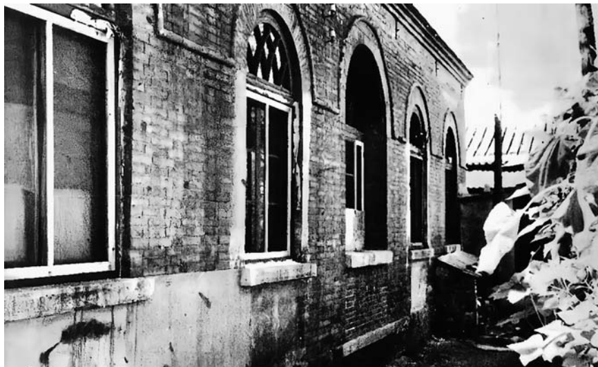
1920年3月由李大钊指导、邓中夏等人在北京大学成立的马克思学说研究会活动场所——亢慕义斋

1920年3月，李大钊与邓中夏等人经过多次酝酿讨论，在北京大学发起成立了马克思学说研究会，“以研究关于马克思派的著述为目的”，后在北京大学西斋建立一个图书室，取名“亢慕义斋”，搜集和翻译马克思主义书籍，进行专题研究，举办讲演会，举行辩论会，马克思学说研究会立足北京、影响全国，在马克思主义传播宣传上发挥了引领作用。“正是李大钊同志等一批革命家的艰辛努力，使马克思主义在中国得到广泛传播。”（习近平：《在纪念李大钊同志诞辰120周年座谈会上的讲话》，《人