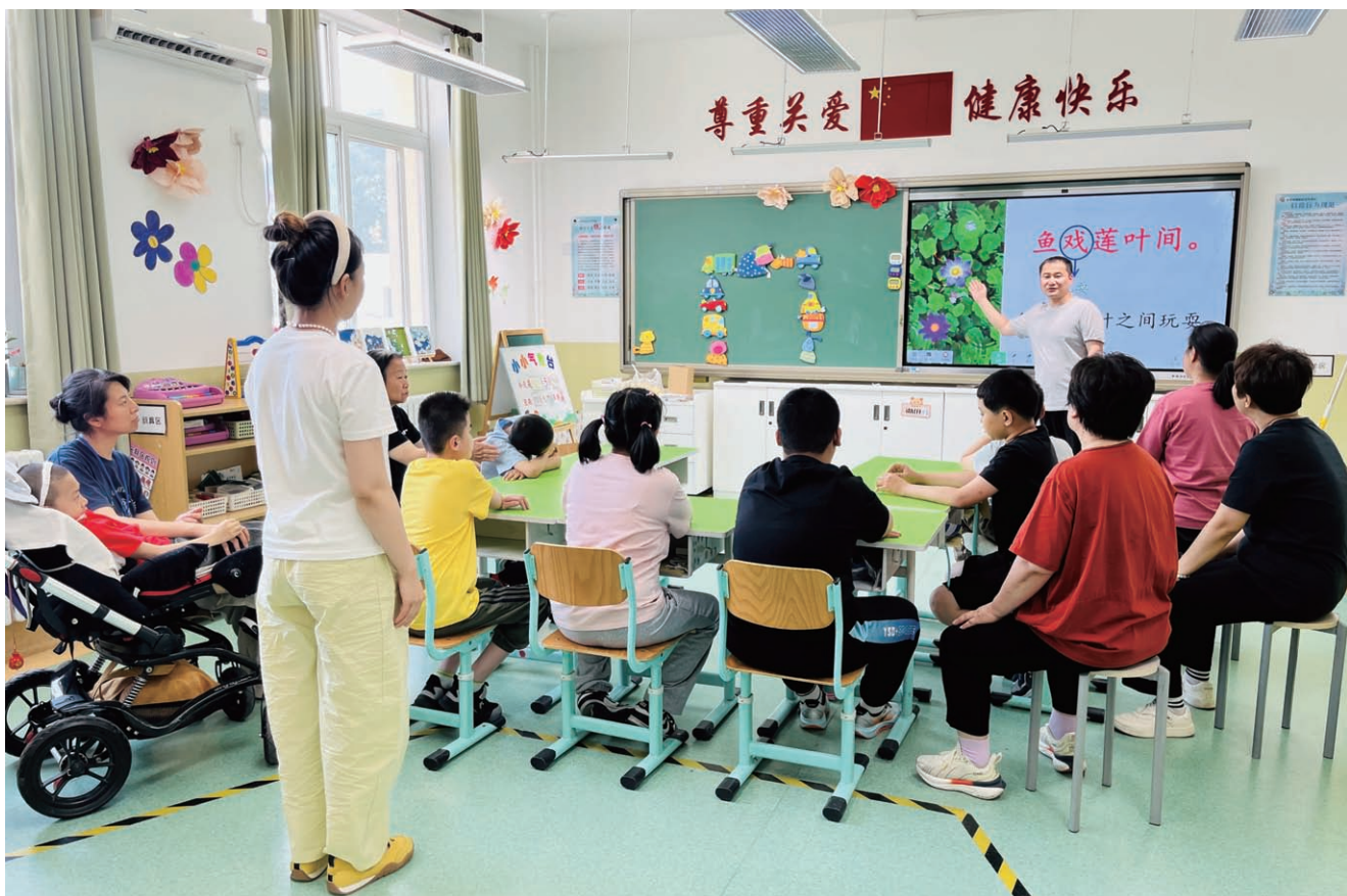
北京市某特殊教育学校课堂授课情景

打通政策落地“最后一公里”，让特殊教育各项惠民政策精准惠及每一名特殊儿童及其家庭。