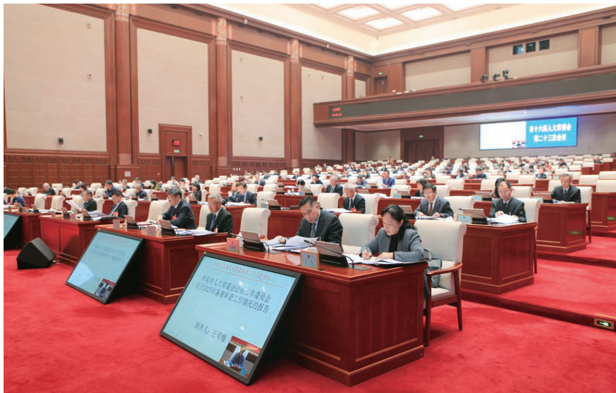
会议听取法制工作委员会关于2025年备案审查工作情况的报告。