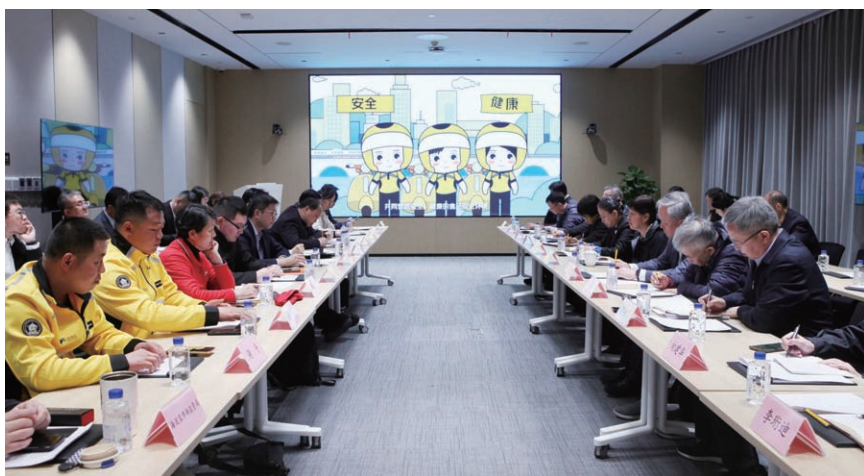
4月3日，执法检查组与监管部门、外卖平台企业、直播电商企业、平台内经营者、骑手代表等座谈交流。

食品安全关系人民生命健康、关乎国计民生。一场紧盯“问题”的调研目的不是挑错，以问题意识找痛点、问计策，恰是寓支持于监督之中的生动体现。守护人民群众“舌尖上的安全”仍是任重道远的事业。我们期待，以此次监督与立法的“双驱动”，为持续筑牢首都食品安全防线增加更多法治保障。✍