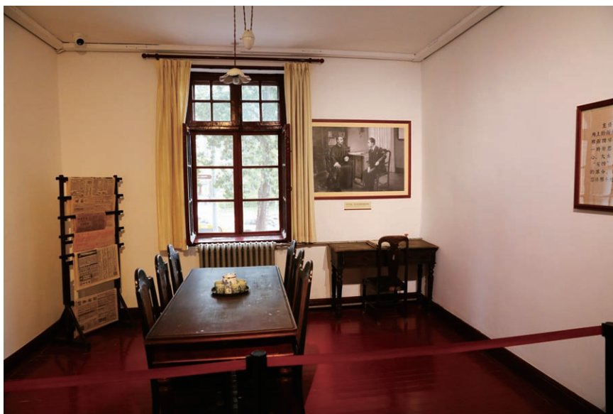
北大红楼图书馆主任室会客厅

中国共产党成立前夕，国内外八个地方建立了党的早期组织，共有党员50多名。其中，北京共产党早期组织成员先后就有17名：李大钊（就义）、张申府（后为旅法支部，后退党）、张国焘（叛变，开除出党）、罗章龙（开除出党）、刘仁静（开除出党）、邓中夏（就义）、高君宇（病逝）、范鸿劼（就义）、何孟雄（就义）、张太雷（牺牲）、缪伯英（病逝）、宋介（后沦为汉奸）、吴汝铭（开除出党，叛变）、李梅羹（病逝）、朱务善（赴苏蒙冤，1955年归国）、江浩（病逝）、陈德荣（脱党）等，这些早期党员总体上信念