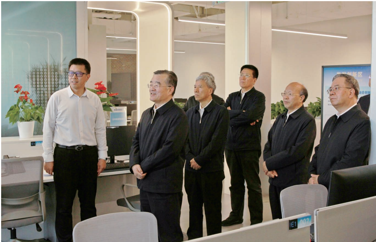
4月10日，全国人大常委会副委员长张庆伟来京调研，市人大常委会主任李秀领陪同调研。图为在数智北京创新中心调研。