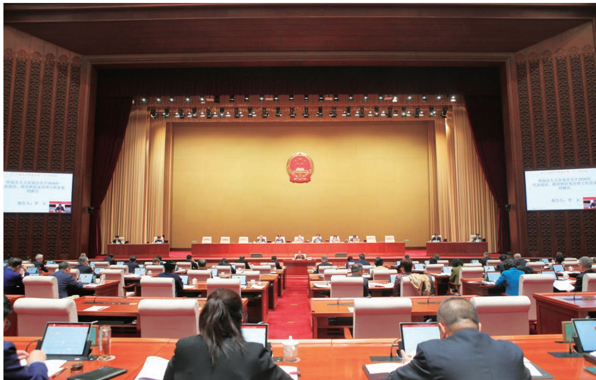
3月26日至27日，市十六届人大常委会第二十三次会议召开。市人大常委会主任李秀主持会议。