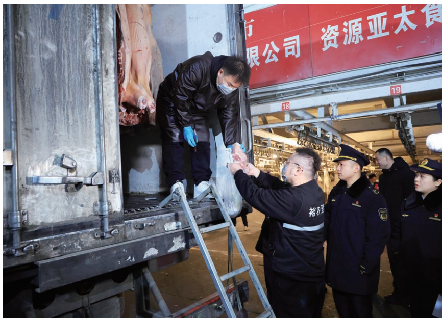
2026年2月，市场监管执法人员开展农批市场夜间检查。

民以食为天，食以安为先。下一步，我局将立足“十五五”开局之年各项工作要求，充分发挥市食安委办的统筹协调作用，以此次食品安全“一法一规定”执法检查为契机，一体推动食品安全突出问题“查、改、治”，一体谋划本市食品安全综合性地方立法，持续建强首都食品安全现代化治理体系，着力提升全链条监管质效，坚决筑牢首都食品安全防线，以更高标准、更实举措守护好人民群众“舌尖上的安全”。✍