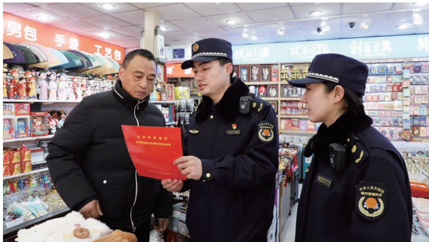
2026年2月11日，大栅栏街道综合行政执法队检查“门前三包”责任制落实情况。

上述问题表明，当前的基层执法在“民意诉求引导”机制下能够维持高效响应，但在迈向依法治理、系统治理的更高目标时，受到