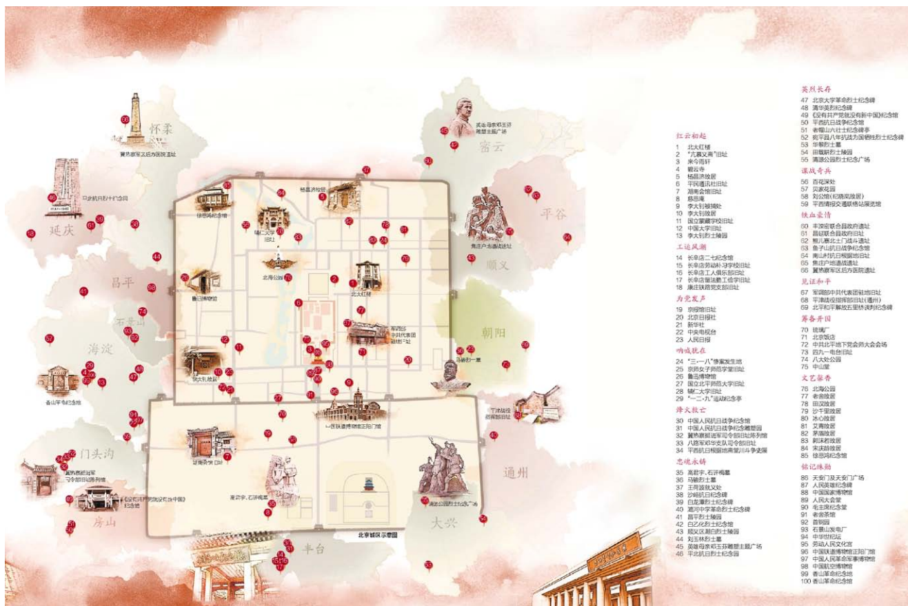
北京的红色地标 图片编绘：杨昌平 姜宝君 冯晨清