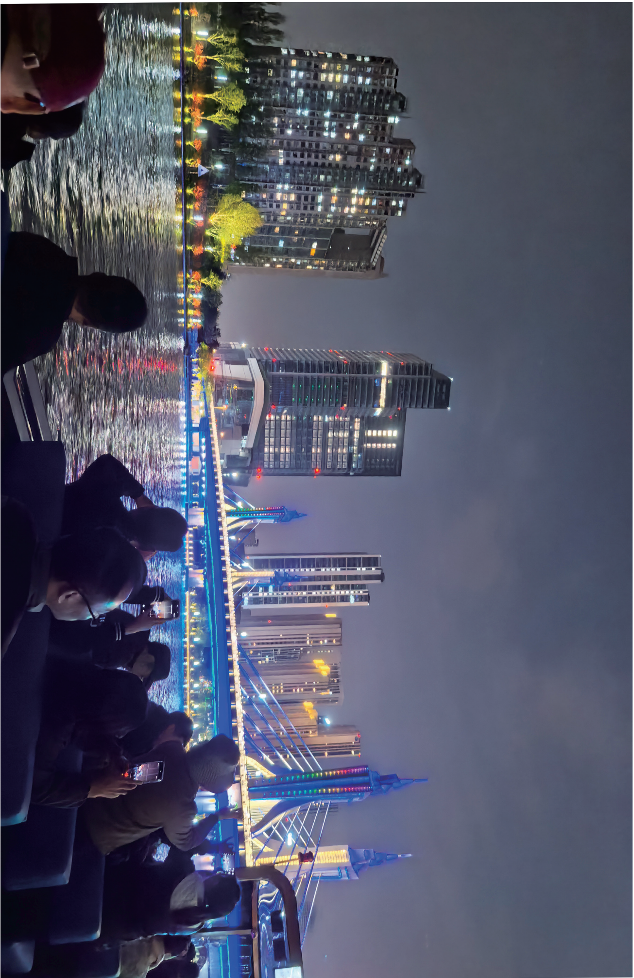
摄影作品欣赏 遇上行 摄影 / 雨阳