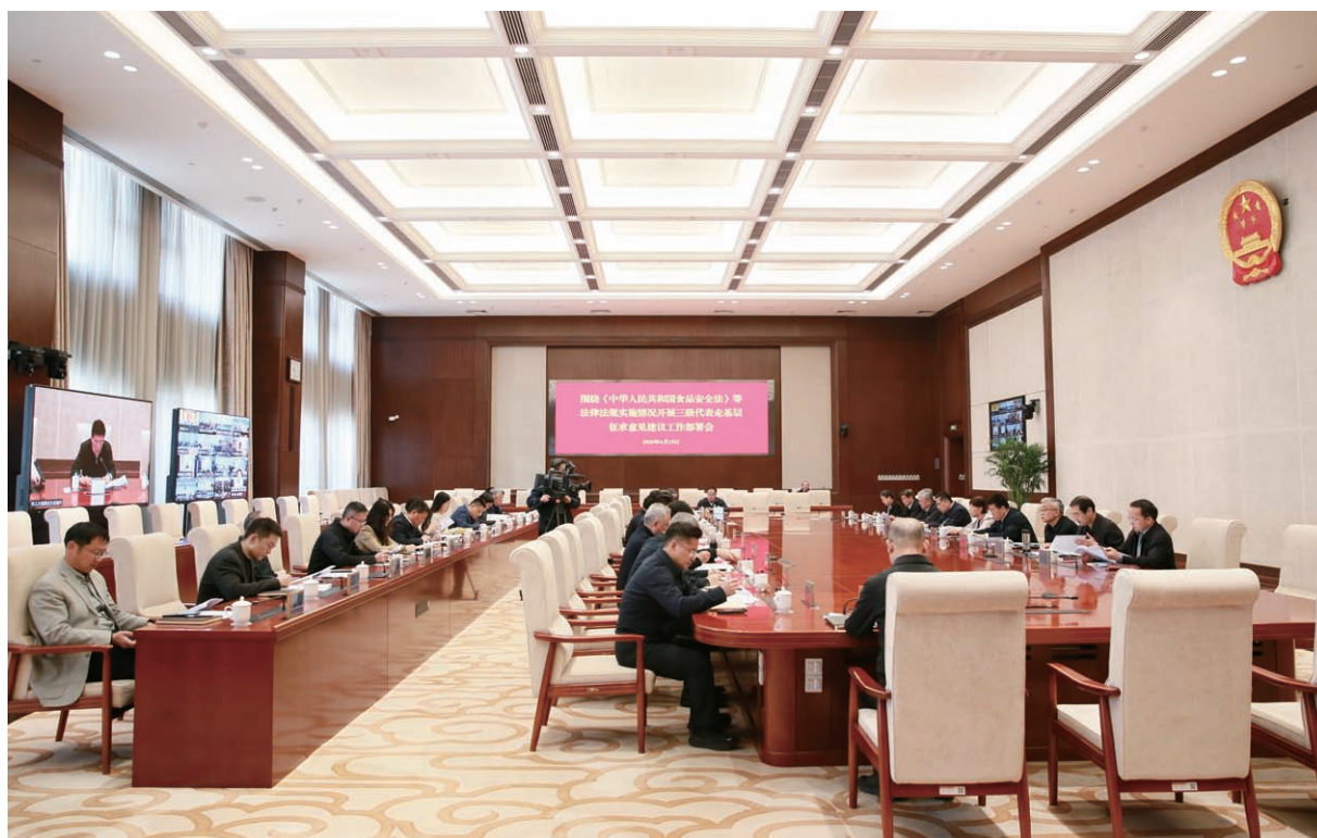
4月15日，市人大常委会围绕《中华人民共和国食品安全法》等法律法规实施情况召开三级代表走基层征求意见建议工作部署会。