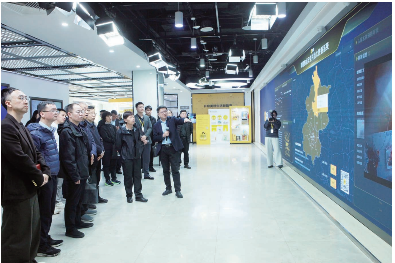
4月3日，执法检查组到北京三快科技有限公司调研网络平台入网资质审查机制执行、配送环节食品安全责任履行等情况。

于监管之外。全市130个农村大集的监管职责分工还需进一步厘清，市市场监管、农业农村、商务、城管执法和区政府、乡镇政府之间的协同监管合力有待增强。