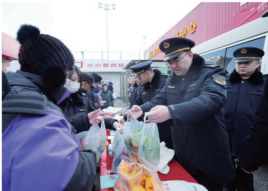
2026年1月，市场监管部门在五道口集贸市场开展“你点我检”年货食品安全专场活动。

食品安全是须臾不能放松的“国之大者”。北京始终坚持以政治引领食品安全工作，把责任体系建设作为关键抓手，层层传导压力、级级压实责任，推动食品安全