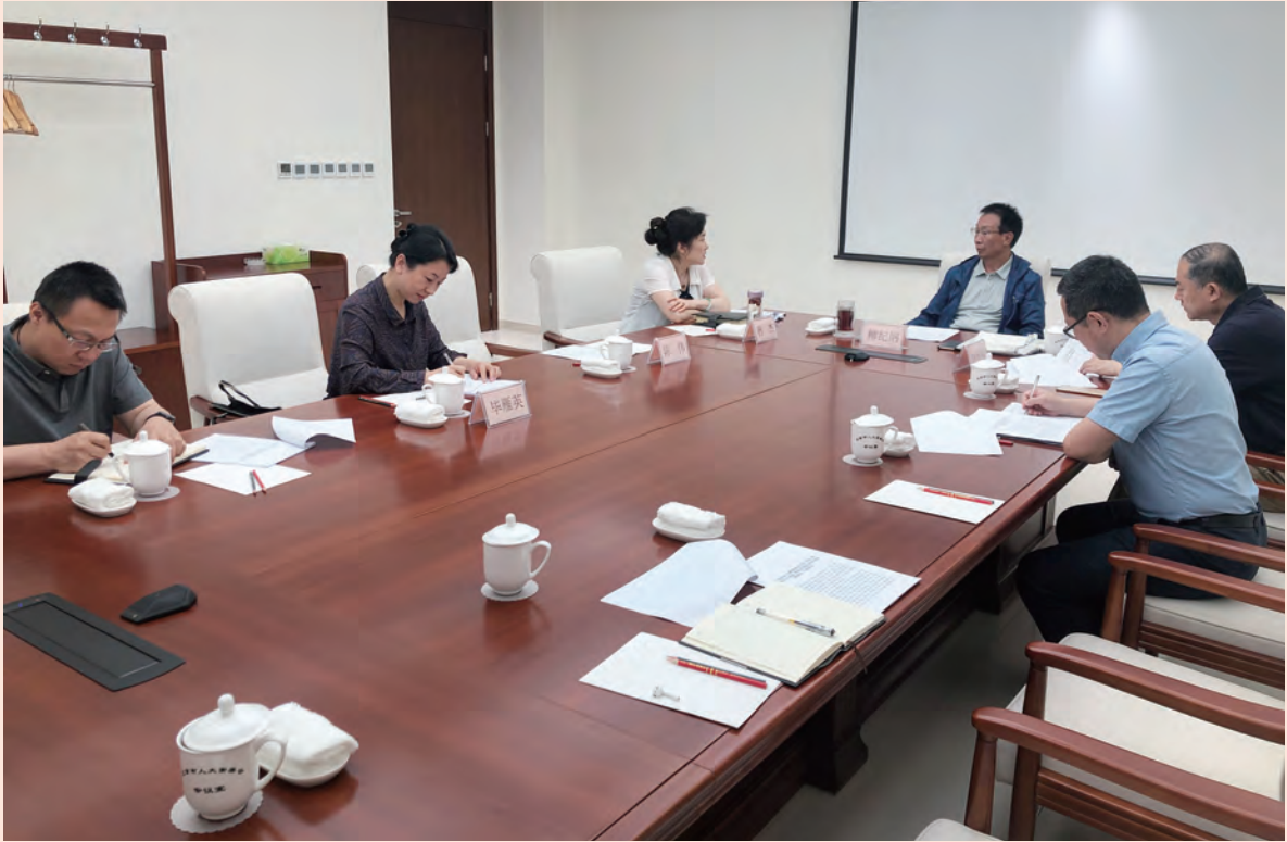
5月31日，市人大民宗侨外委课题组向市人大制度理论研究会提出关于“积极履行人大职能，推动北京国际交往中心建设”课题立项的申请，市人大常委会民宗侨办公室主任孙杰作情况报告，研究会会长柳纪纲听取了汇报。