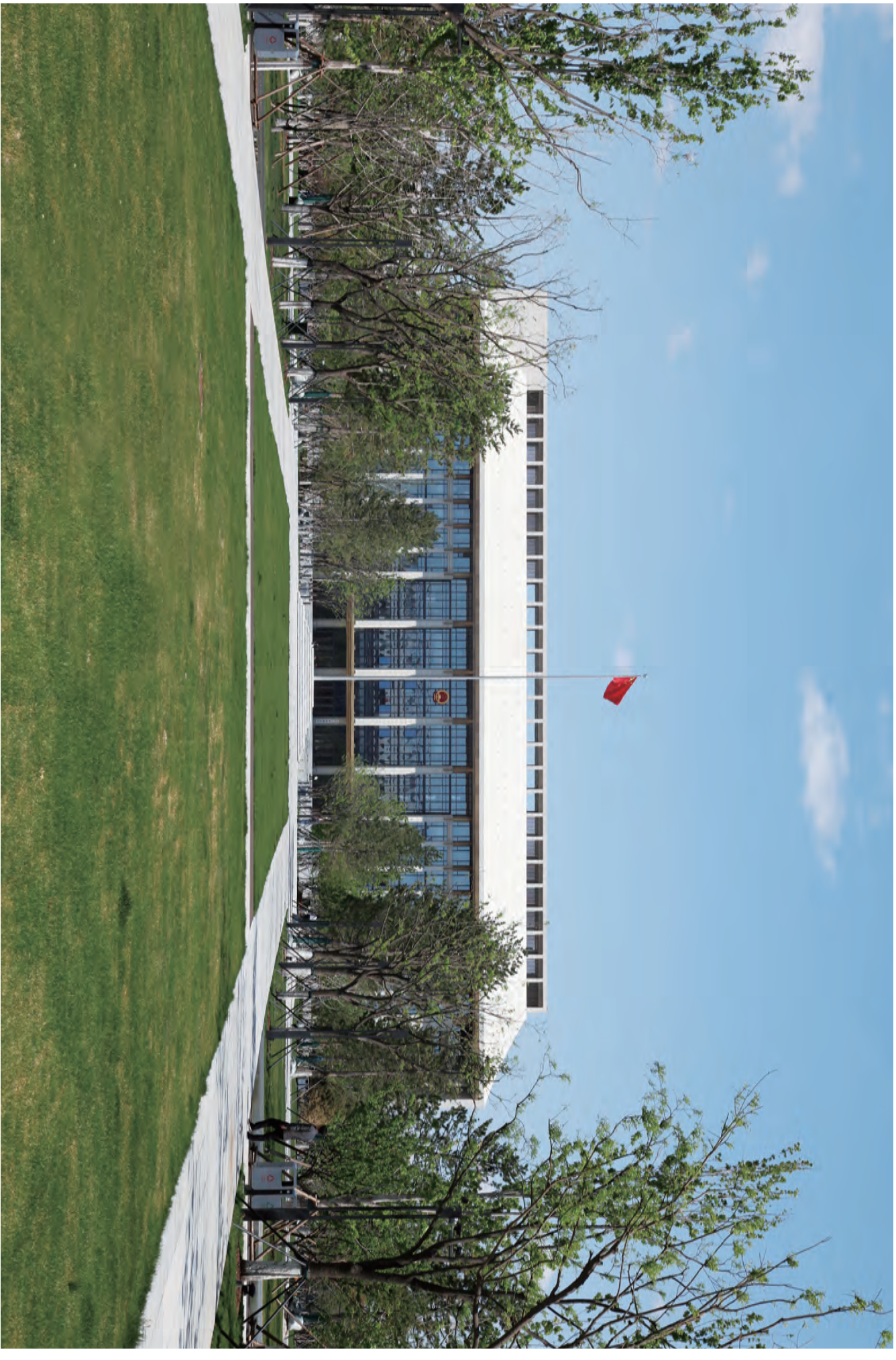
市人大常委会机关办公楼