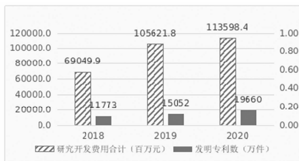
图 2. 2018—2020 年北京市规模以上中小微 企业研发投入及发明专利情况

1—3 季度,全市中小企业累计申请预审合格进入国家知识产权局快速审查通道的专利 3050 件,占全市申请总量(5013 件)的 61%,同比增长 196%,其中发明专利 2904 件,同比增长 2.1 倍。获授权专利 2159 件,同比增长 3.1 倍,其中发明专利 2023 件,同比增长 3.6 倍。全市认定登记技术合同 61589 项,技术合同成交额 4641.6 亿元,同比增长 10.1%,其中,电子和医药领域的合同占比超 6 成。中小企业输出技术合同 31776 项,成交额 1011.6 亿元。