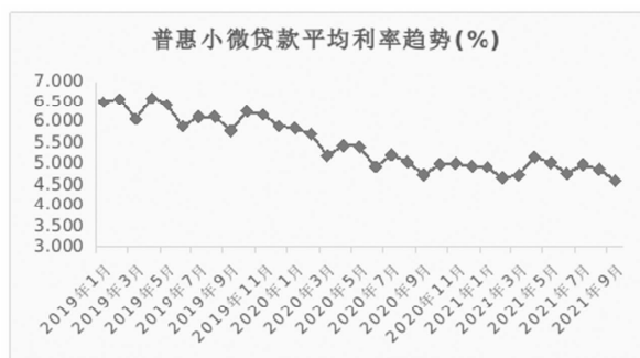
图 3. 2019—2021 年北京市普惠小微贷款平均利率趋势图