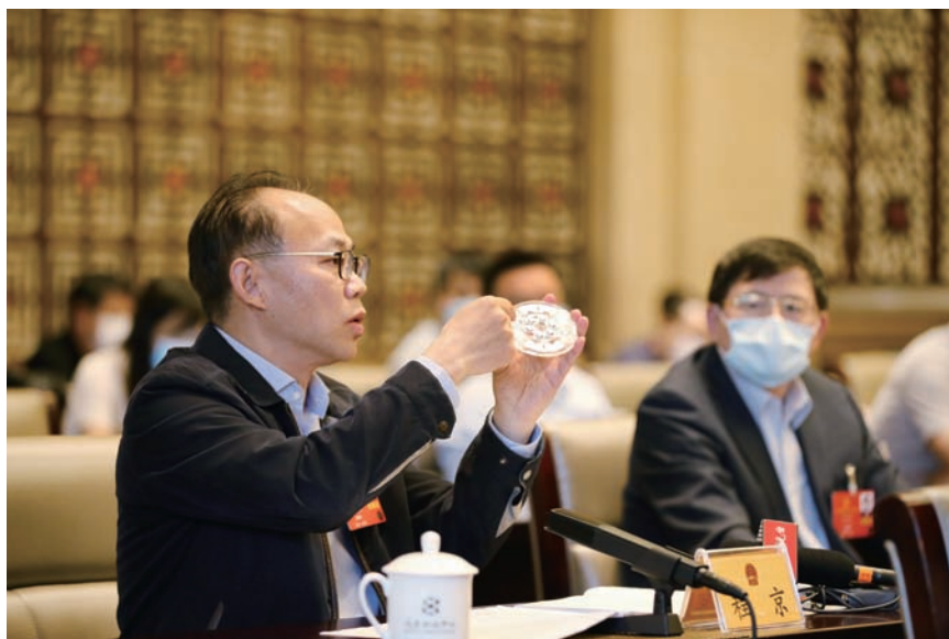
生物芯片北京国家工程研究中心主任、中国工程院院士程京代表审议发言