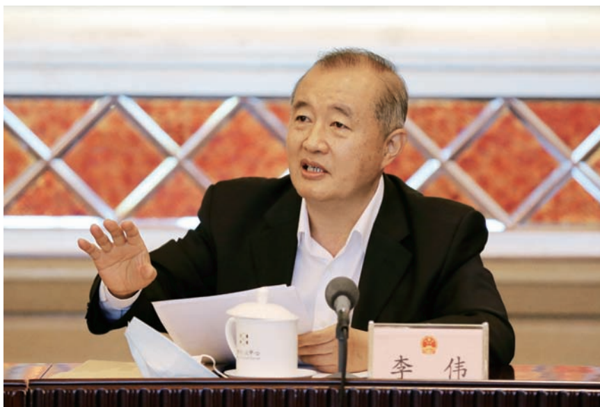
北京市人大常委会主任李伟代表审议发言