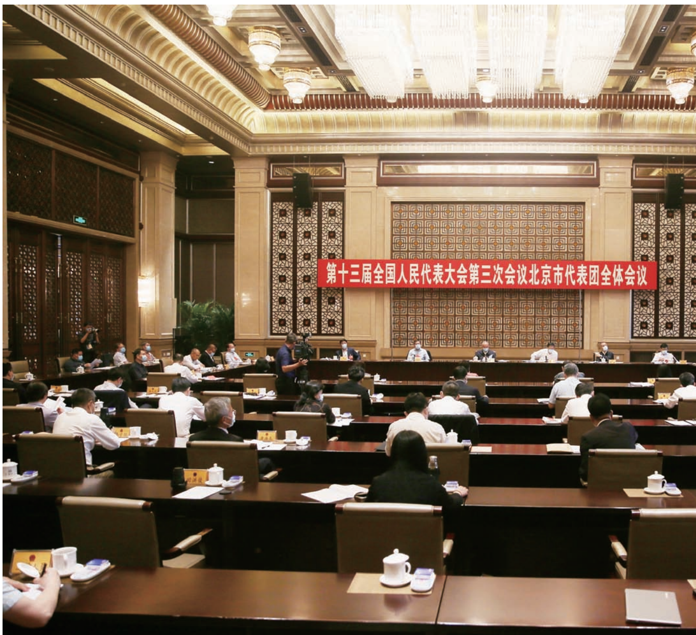
十三届全国人大三次会议北京代表团举行全体会议