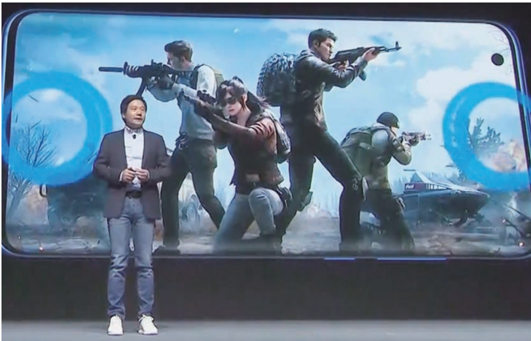
2月13日，小米召开产品“云发布会”，促进复工复产

雷军说，从报告中读到了希望，读到了美好前景。“生活可以被疫情所影响，但是绝对不能被疫情所打败。”他的发言引起了大家广泛的共鸣。✍