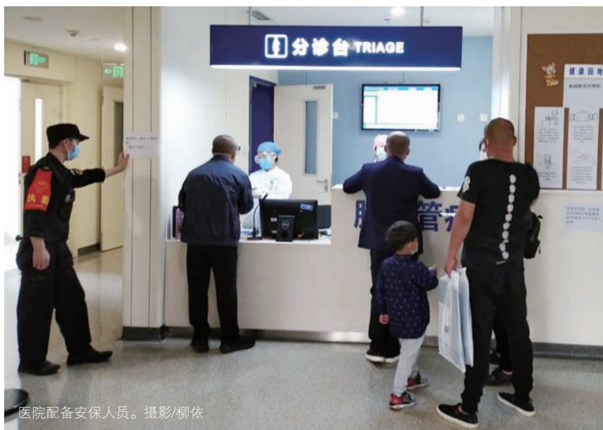
医院配备安保人员。摄影/柳依