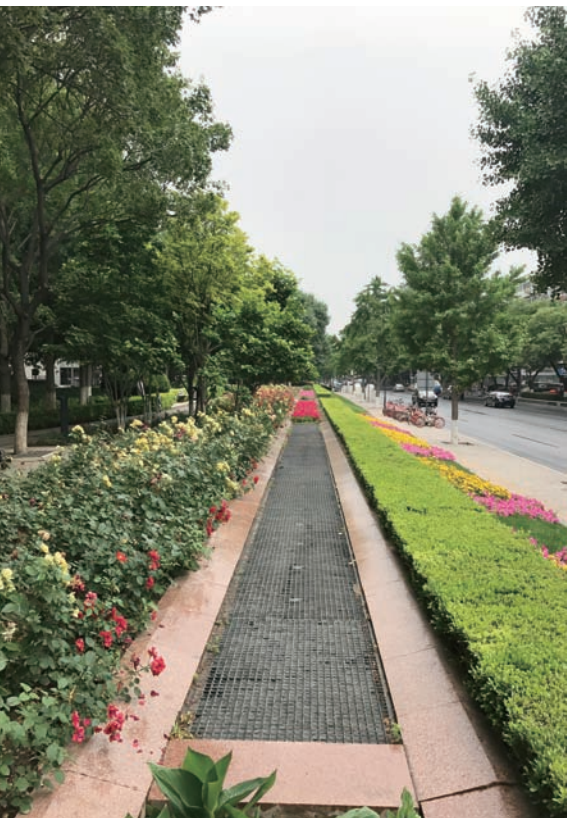
皇城根遗址公园。

河道交错、山水交融是自古以来营城特色。结合天然河流、湖泊等水体布置城市公园绿地，提供更多的绿色缓冲空间和休闲娱乐休闲设施。滨水公园具有覆盖面广、