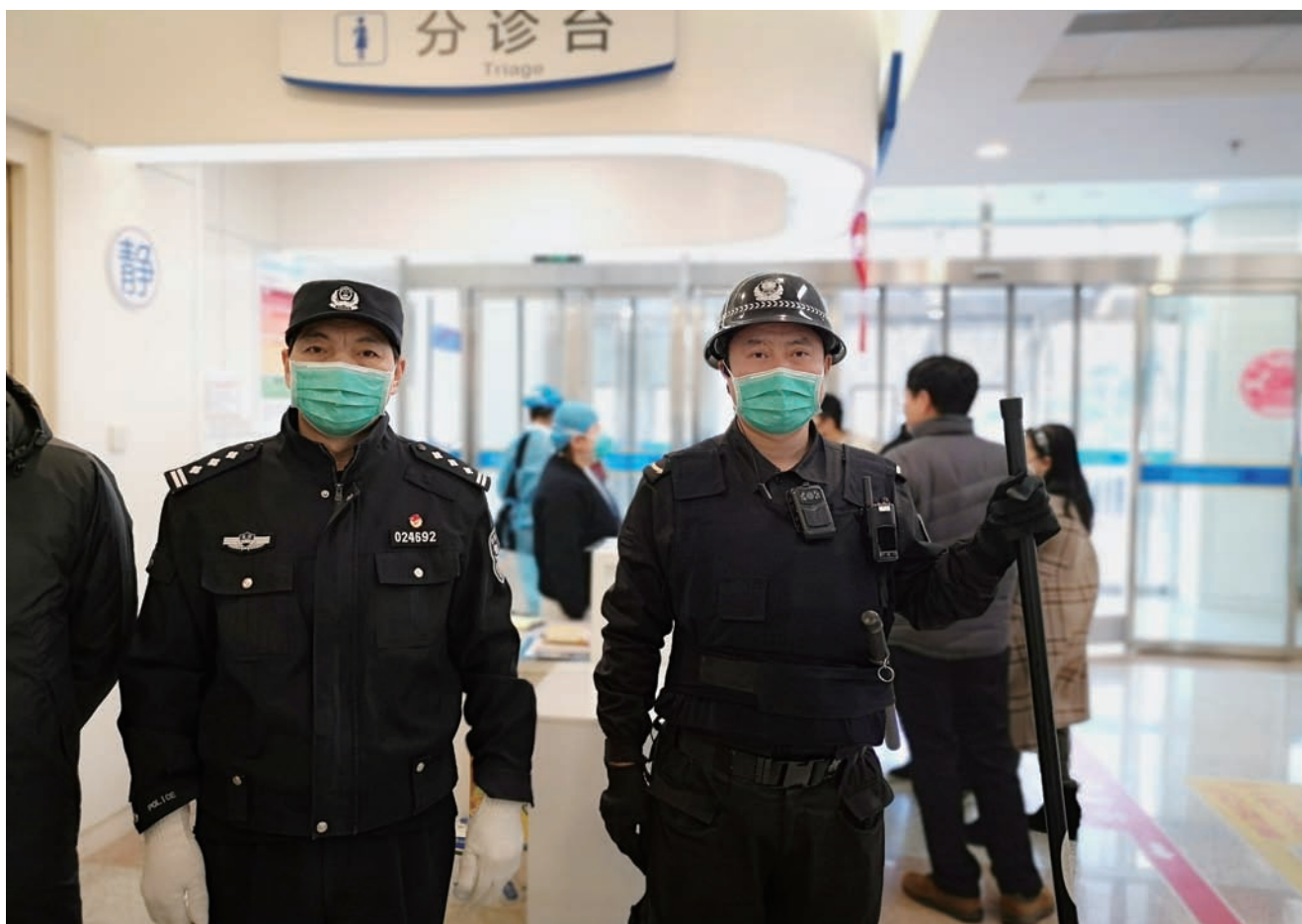
北大人民医院警务室民警带领治安保卫人员巡逻。

6月5日，市十五届人大常委会第二十二次会议审议通过了《北京市医院安全秩序管理规定》（以下简称规定）。市委、市人大常委会、市政府高度重视保护医务人员、维护医院安全秩序工作，将推进医院安全秩序立法纳入重要议事日程，作为完善法治保障体系，运用法治思维和法治方式，提高依法治理能力水平的重要举措。这次