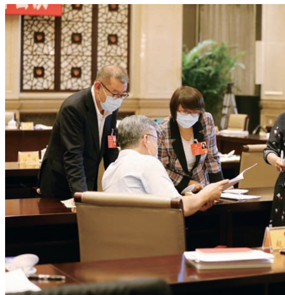
审议间隙，代表们还在热烈讨论