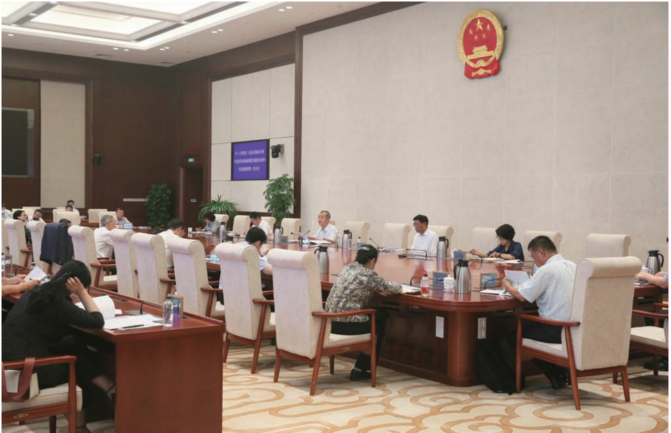
6月11日，市人大常委会启动机动车和非道路移动机械排放污染防治条例执法检查，市人大常委会主任李伟参加检查组第一次会议并讲话。