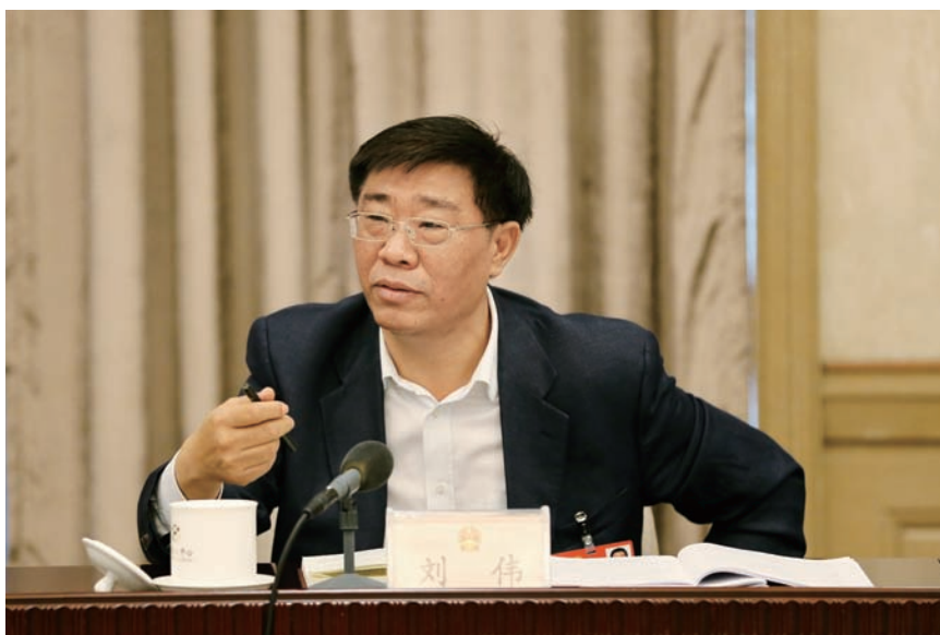
北京市人大常委会副主任刘伟代表审议发言