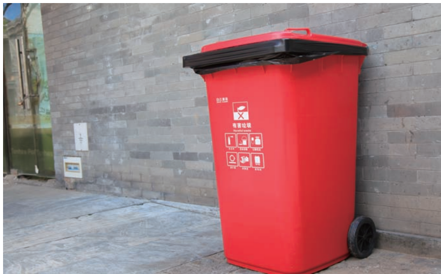
前门步行街设置有害垃圾桶。