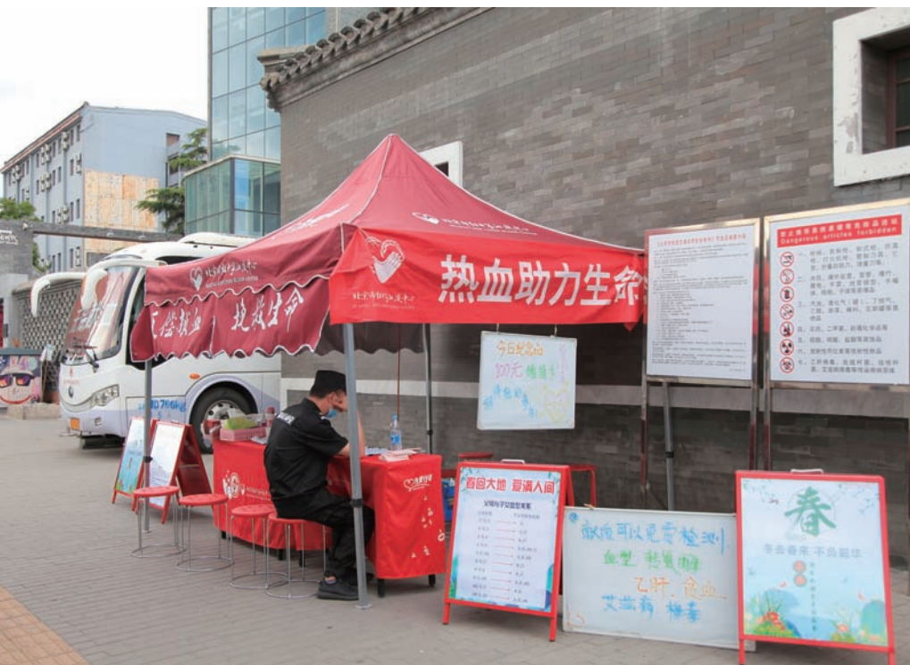
北京街头设置的流动献血点儿。

五是加强宣传工作，结合法规贯彻实施，积极宣传解读公共卫生重要法规制度，增强市民公共卫生法治观念，引导市民依法有序参与疫情防控，推动全社会形成科学健康的生活方式。☑（整理/张雪松）