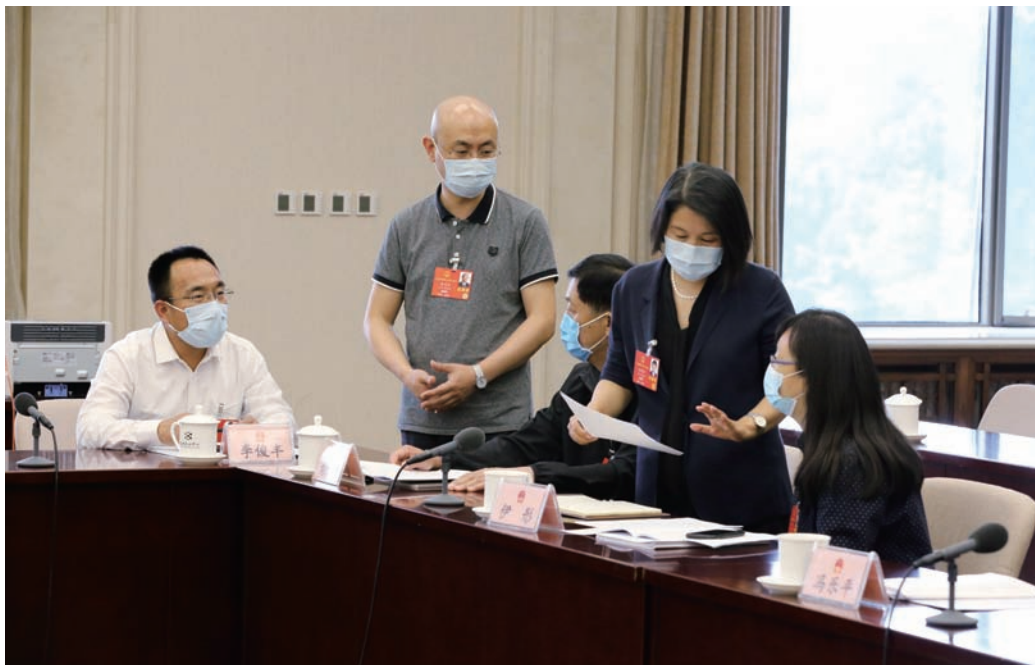
代表讨论拟提交的议案

建设、引力电力高质量发展、提高居民环保意识等方面。四是广泛关注保障和改善民生。相关的教科文卫体类和社会及公共事务类建议有39件。其中，代表较为关注的具体问题，涉及教育、医疗、养老、就业、粮食安全、困难群众生活保障等方面。