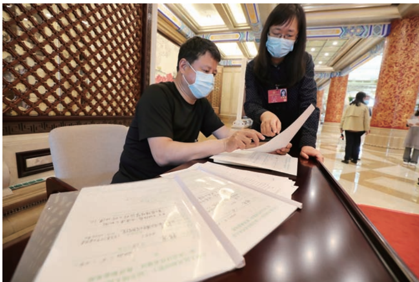
代表提交议案建议

系建设，相关建议有12件。建议内容集中在建立公共卫生突发事件应对机制，修改《传染病防治法》，完善疾控中心管理体系等方面。二是集中关注京津冀协调发展，相关建议有9件。建议内容集中在培育京津冀协同发展新动能、加快雄安新区智慧城市建设、推动首都城市复兴进程等方面。三是持续关注加快改善生态环境，促进绿色发展等问题，相关建议有8件。建议内容集中在建设灾害预警公共服务体系