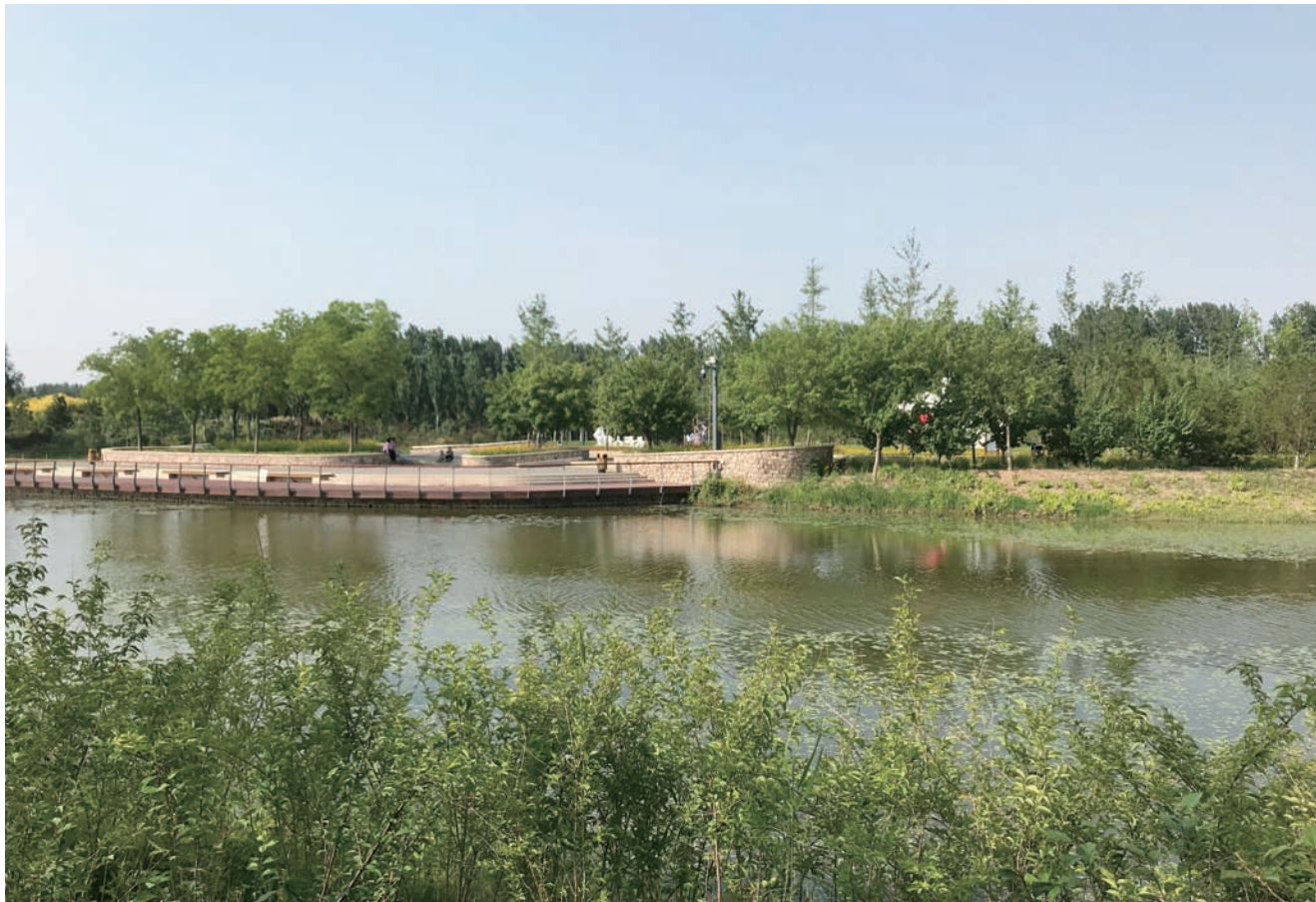
东郊湿地公园。

延续北京赏花游园活动传统，各区形成特色赏花景点，建设一批街头绿地，制定花景建设规划并推出季节性游赏计划，丰富市民文化生活并吸引观光游客。优选植物品种，增加适合北京的开花植物种植