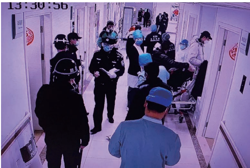
北大人民医院警务室民警开展安全检查。

立法主要内容的“小切口”。立法主要内容体现着立法要解决的主要矛盾，有意见提出当前影响医院安全秩序、导致暴力伤医的重要因素是医疗纠纷或医患矛盾，应当将预防和化解医疗纠纷和解决