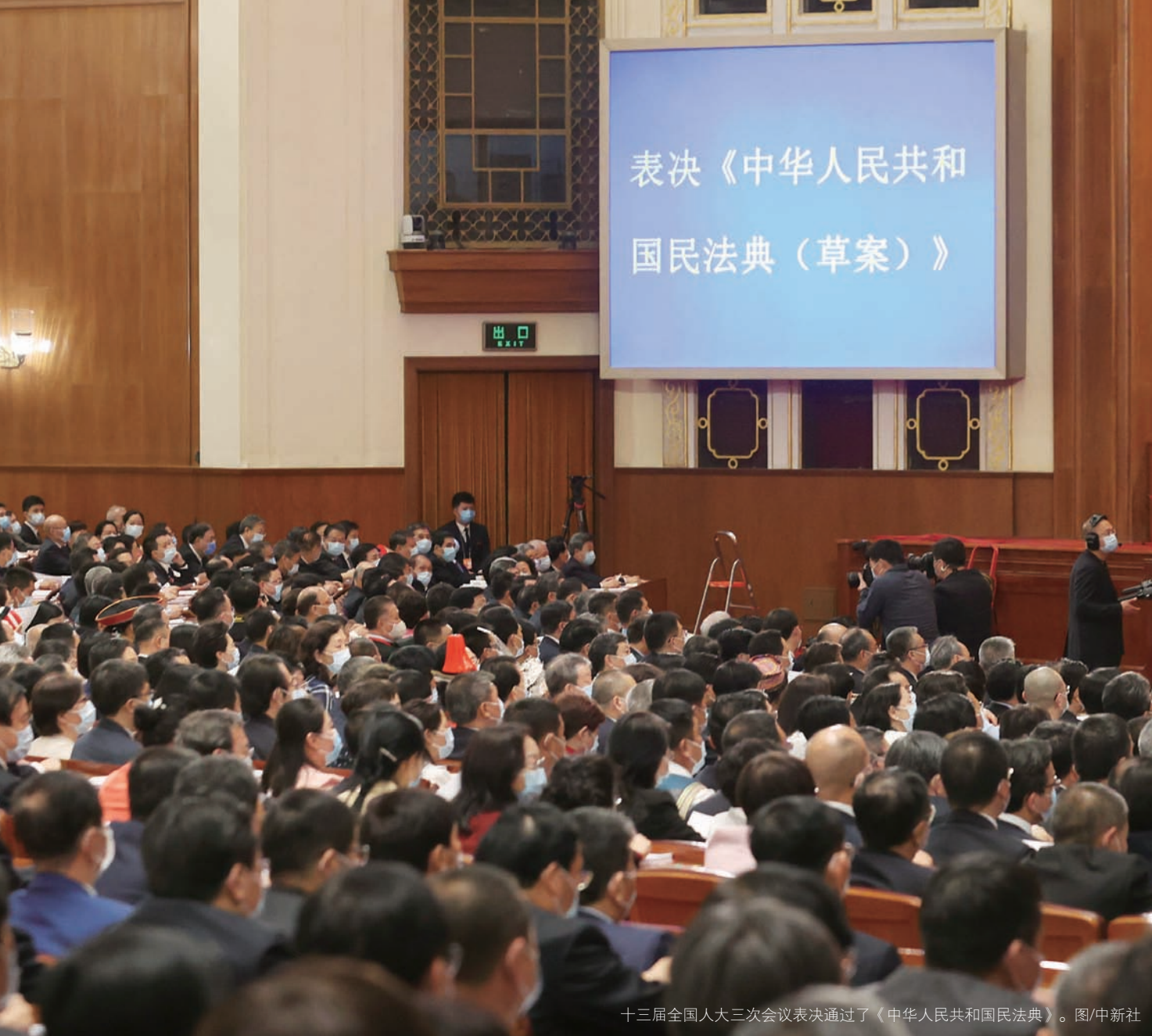
十三届全国人大三次会议表决通过了《中华人民共和国民法典》。

实现的保护力度，等等。这些制度安排充分体现了以人民为中心的发展思想，有助于更好地满足人民日益增长的美好生活需要。