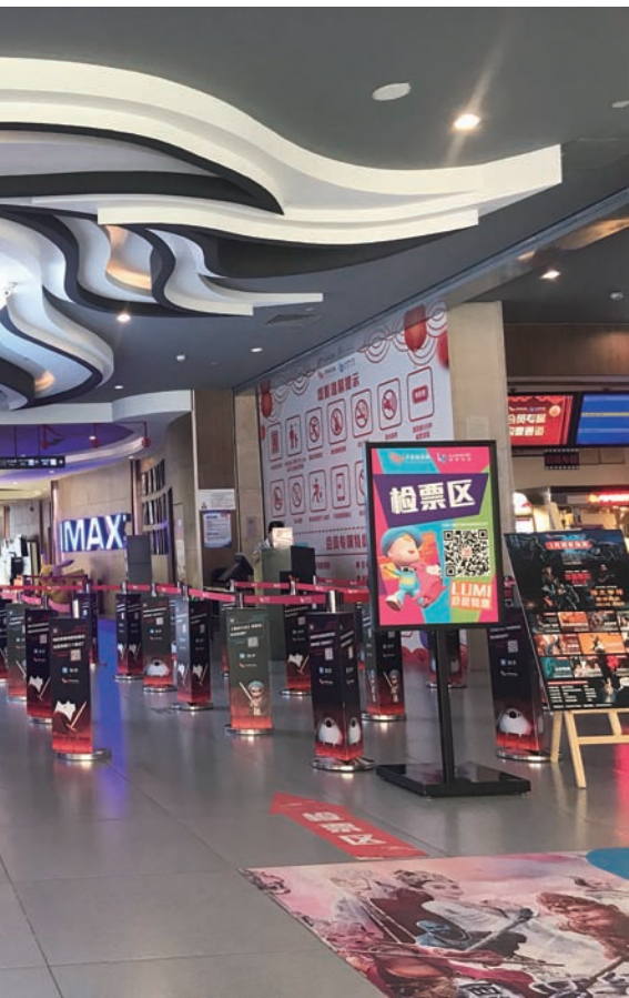
推动北京电影产业高质量发展。

财政经济委员会认为，为进一步推动北京电影产业高质量发展，研究制定促进北京市电影产业发展的地方性法规是很有必要的。建议，综合考虑本市文化产业的发展实际和立法需求，做好促进电影产业发展方面的立法可行性研究和制度设计，同时密切关注文化产业促进法、电影产业促进法实施细则的立法进程，适时将促进北京市电影产业发展的立法项目列入常委会立法规划或者立法工作计划。