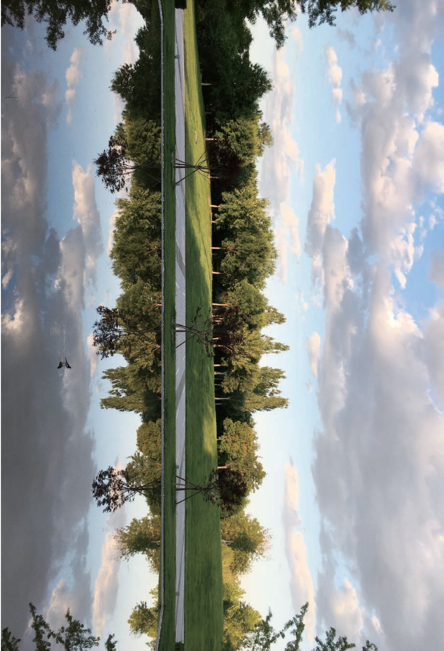
摄影作品欣赏 | 天空之镜 手机随拍 / 雨阳