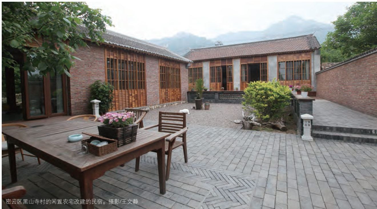
密云区黑山寺村的闲置农宅改建的民宿。

引导通过股份合作、租赁、联营等多种形式，实现集体经济与工商资本合作共赢。及时建立集体资产股份有偿退出和继承机制，加快农村产权流转交易市场建设，研究已城市化地区农村经济组织的存续和健康发展问题。✍