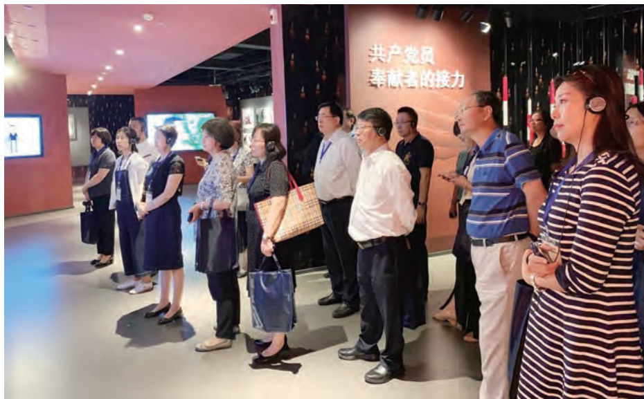
代表们在北京市委党校“口子楼”上现场情景学习课。

在分组研讨和总结交流时，代表们认真总结和交流了学习收获和体会，4位连选连任代表和2位新代表分别围绕代表大会期间如何提好议案建议、审议好各项工作报告、处理好参加闭会期间活动与本职工作的关系、参加代表履职学习的收获和体会以及联系原选举单位和人民群众等重点内容作了交流发言。代表们认为，当前正在开展“不忘初心，牢记使命”主题教育，又正值迎接新中国成立70周年，在这时候市人大常委会组织代表进党校学习，非常必要也十分及时，收获颇丰。