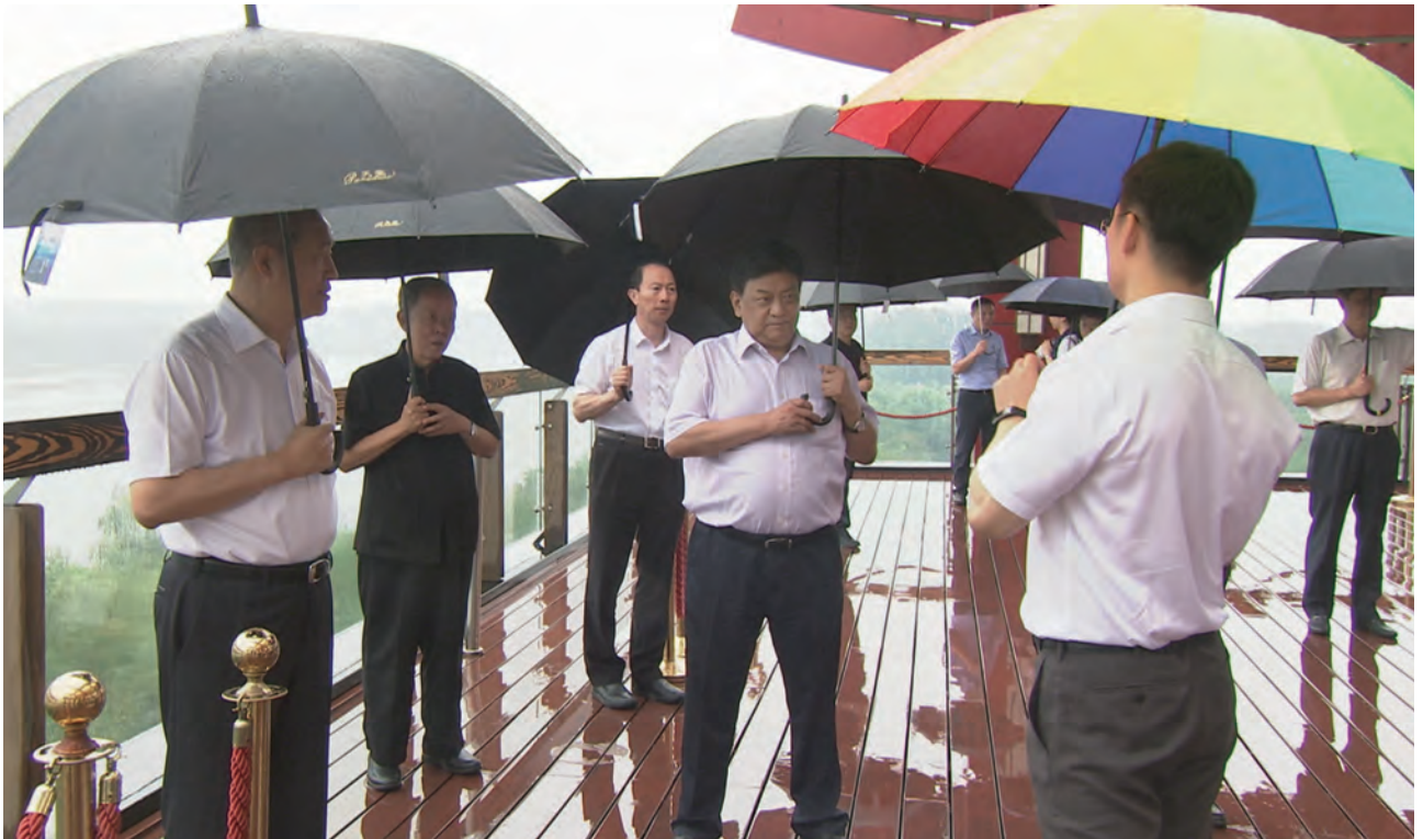
8月20日，全国人大常委会副委员长白玛赤林一行来京调研侨务法治建设情况，市人大常委会主任李伟陪同调研