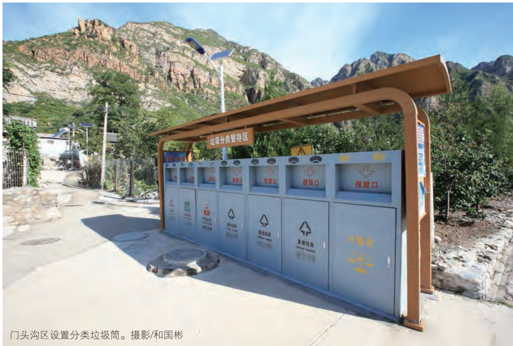
门头沟区设置分类垃圾筒。

“万名代表下基层，全民参与修条例”活动本身就是一次贯彻落实“不忘初心、牢记使命”主题教育活动的生动实践。活动开展以来，全面贯彻习近平总书记对垃圾分类的重要讲话和重要指示精神，全面落实市委九次全会关于要使修订生活垃圾条例凝聚共识、推动工作过程的任务要求，通过修条例推动形成以法治为基础，政府推动、全民参与、城乡统筹、因地制宜的垃圾分类制度。☑