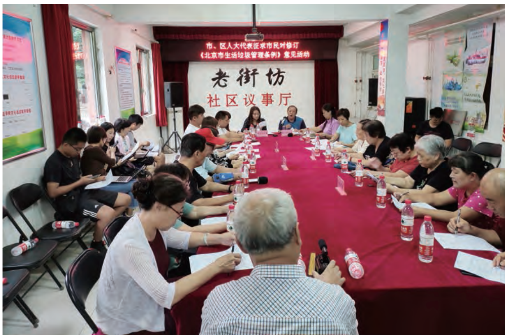
石景山区苹果园街道辛四社区代表见面会。