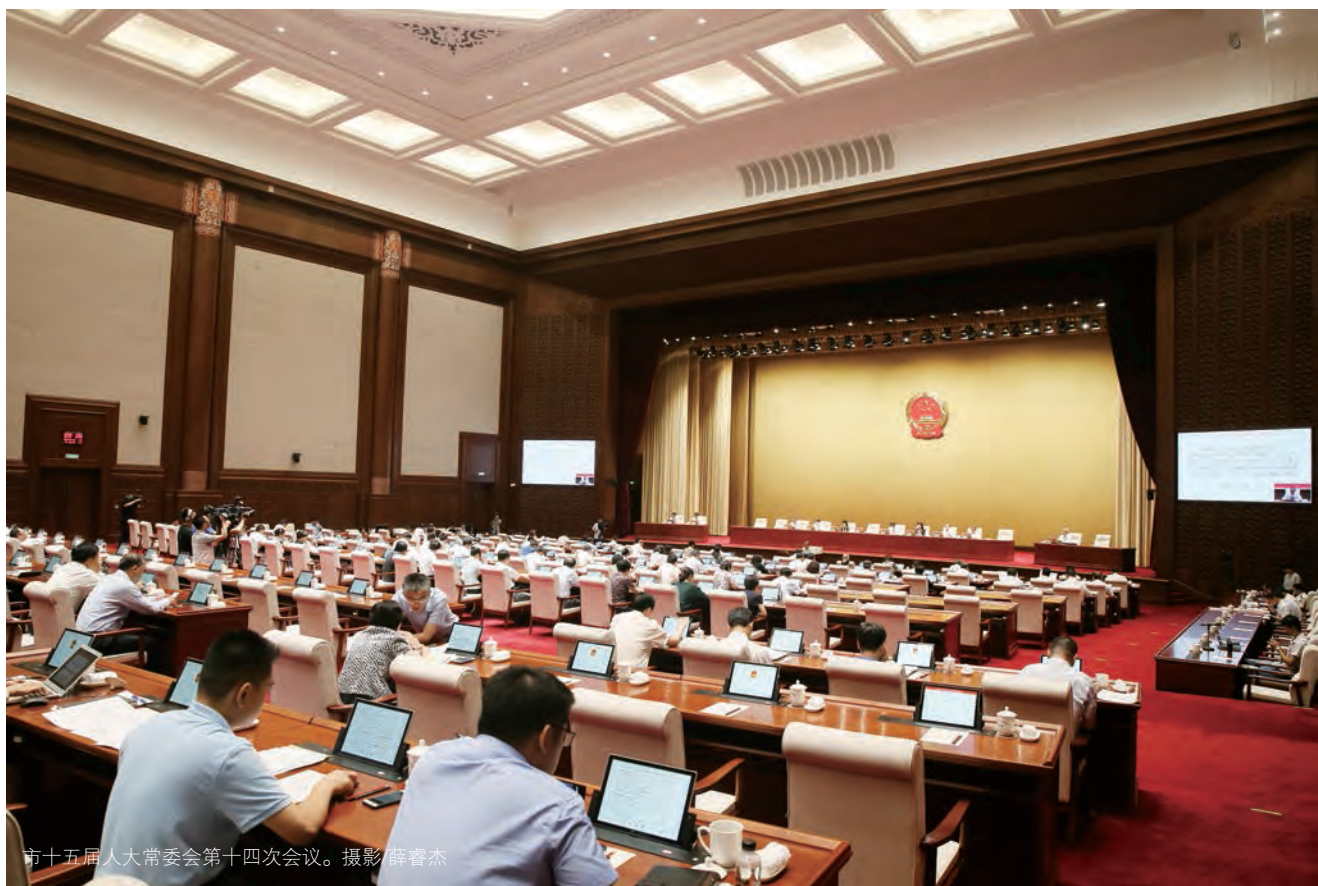
市十五届人大常委会第十四次会议。

在立法过程中，市人大常委会充分发挥在立法工作中的主导作用，在提前介入、专班推进、牵头起草、开门立法和审议把关方面下功夫，在表达、平衡、调整社会利益方面下功夫，在发挥代表主体作用、扩大立法有序参与、广泛凝聚立法共识方面下功夫，提高立法质量和效率，努力为首都发展提供及时、有力、到位的法制保障。