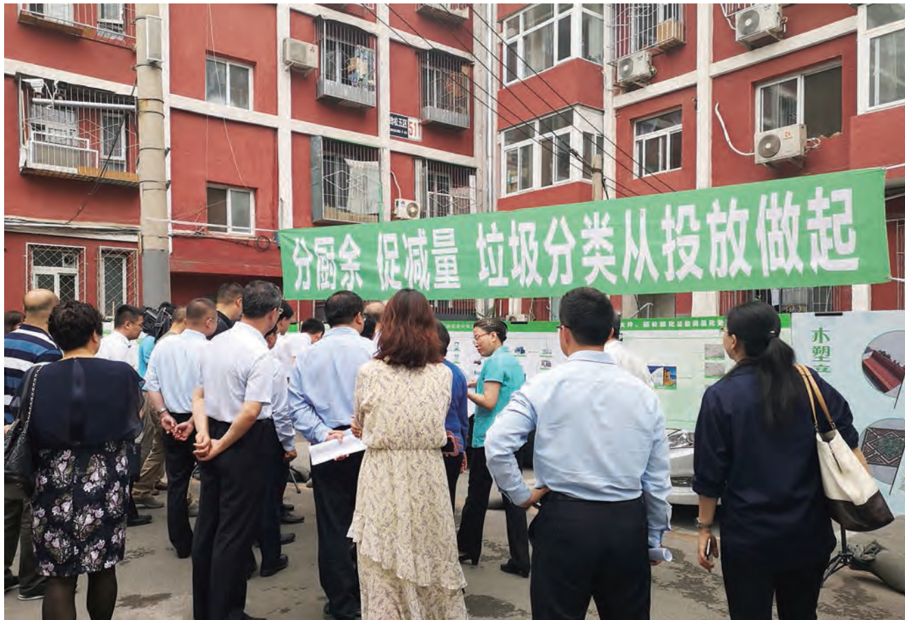
代表走进社区就垃圾分类进行调研、宣讲。

手册，将宣讲提纲内容制作成PPT演示，编入快板书、相声、京韵大鼓等，对生活垃圾管理条例修订工作进行宣讲；有的区采取座谈交流、问卷调查、有奖问答、积分兑换等互动活动，广泛征求市民意见和建议；有的区则组织代表专题集中视察，走进学校、幼儿园，注重垃圾分类从娃娃抓起，或是进行网上宣讲和征求意见，进一步提高市民对垃圾分类的深度知晓率、参与率和征求意见的覆盖面、广泛性。有的乡镇还启用代表联系选民微信群的网络平台，通过微信群下达通