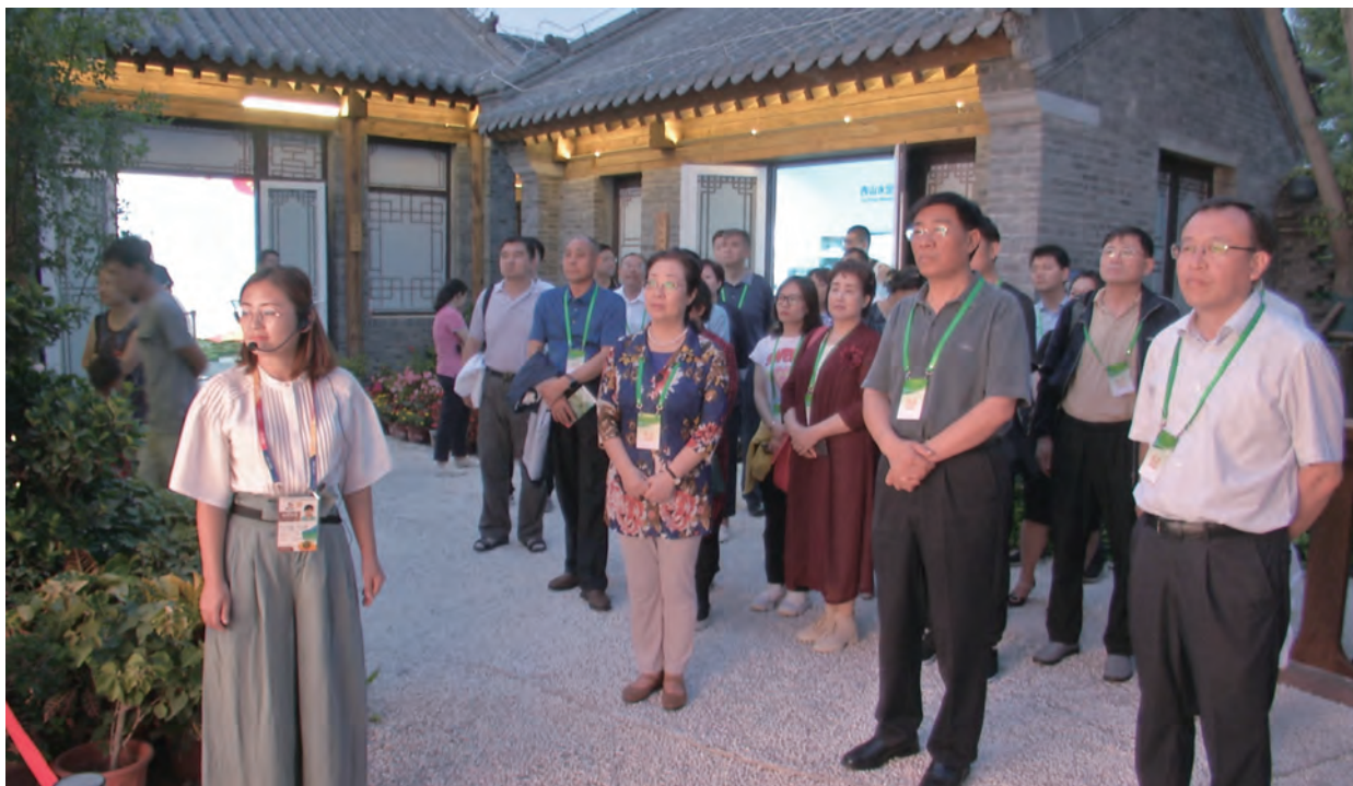
9月5日、6日，全国人大北京团部分代表赴延庆区调研生态涵养区建设情况