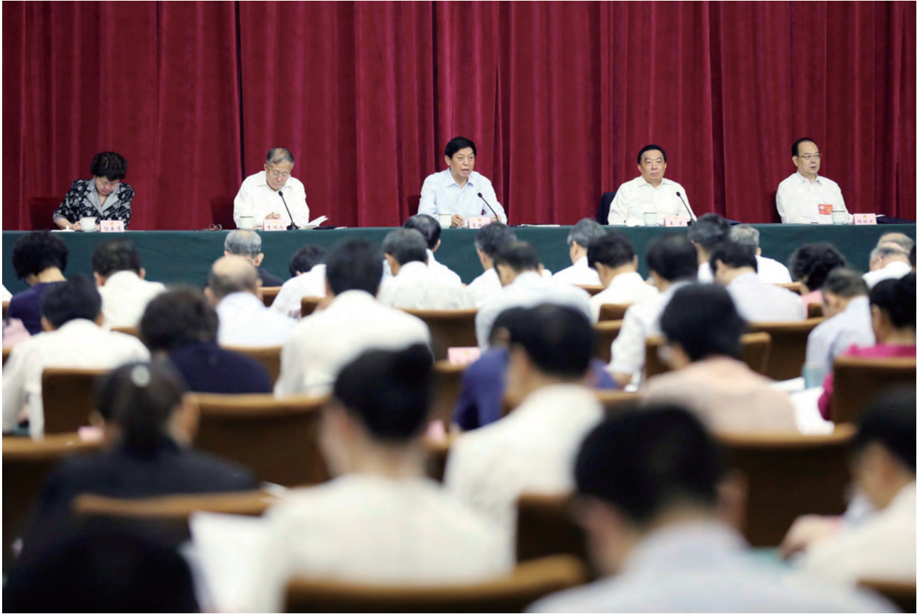
9月4日至5日，省级人大立法工作交流会在天津举行，中共中央政治局常委、全国人大常委会委员长栗战书出席会议并讲话