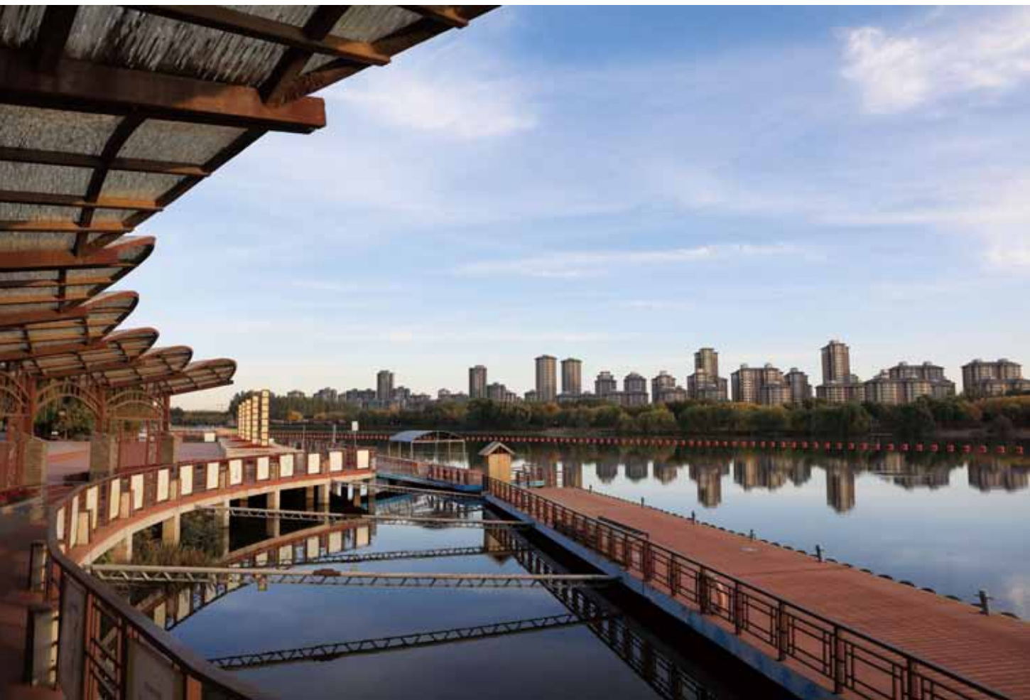
大运河漕运码头。

此外，新修订的《北京市志愿服务促进条例》也于3月1日正式实施。条例共六章50条，明确了本市建立健全大型社会活动志愿服务协调保障机制，按照国家和本市的统一安排，在国家重大活动和政府主办的大型体育赛事、文化交流和展会等活动期间，统筹协调服务保障、城市运行、秩序维护等方面的志愿服务工作。☑