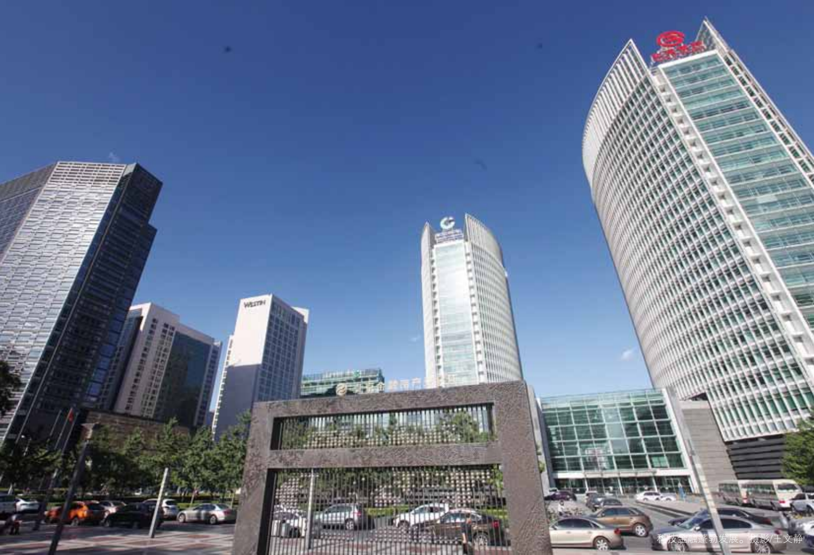
科技金融蓬勃发展。

引进政策的实施办法》等。建议在市委、市政府的指导下，有关部门围绕科技创新中心建设中遇到的难点、堵点和痛点，抓紧研究起草的具体实施方案，通过制定细致有效的配套政策措施，更好地支持北京科创中心建设。