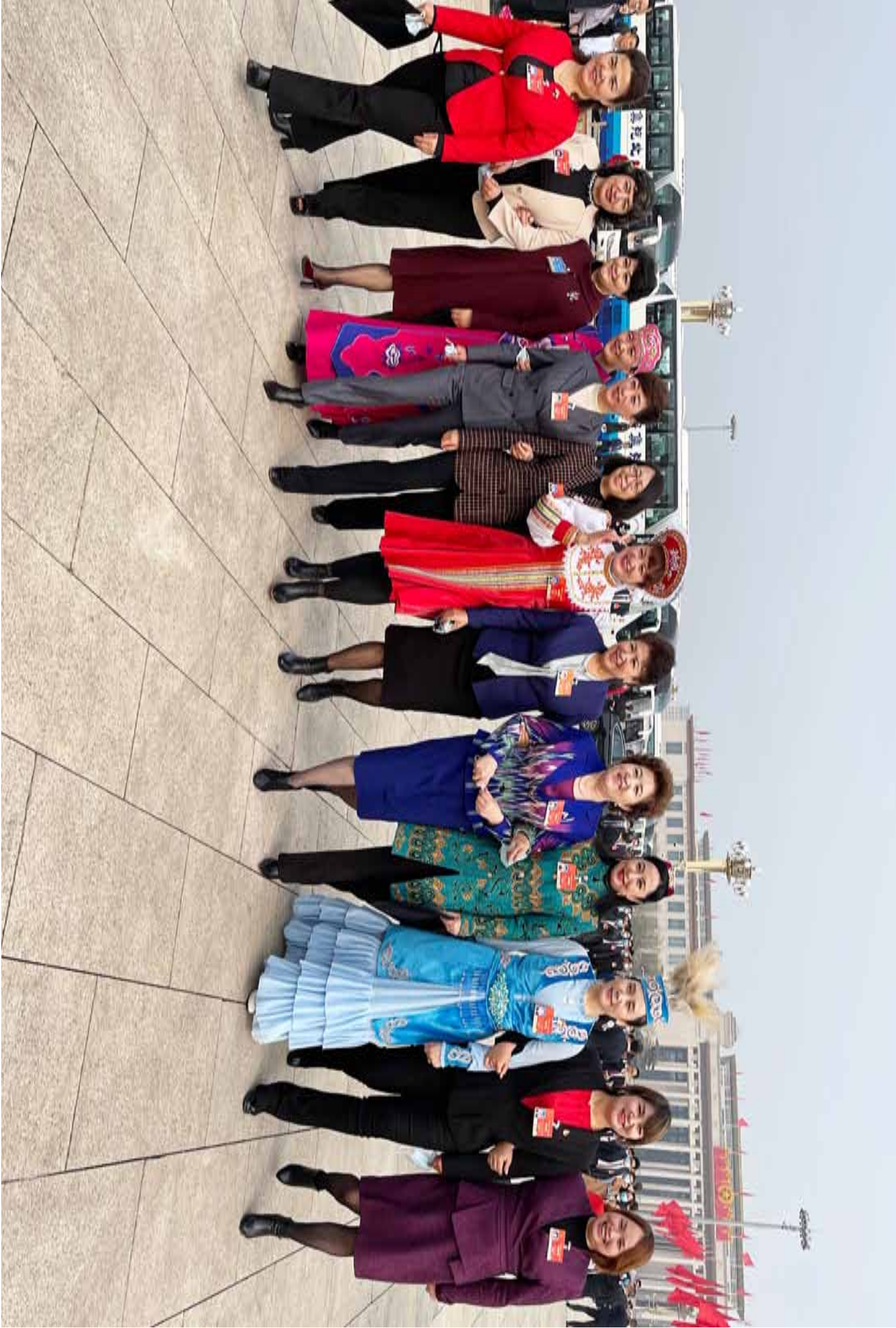
摄影作品欣赏 共赴盛会