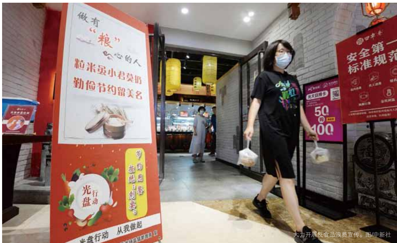
大力开展反食品浪费宣传。

部分餐饮服务企业、单位食堂、网络餐饮服务平台、食品生产加工企业、商超等征求意见。此后，经多次修改，提出了法规草案征求意见稿，通过市人大常委会门户网站和首都之窗网站向社会公开征求意见。