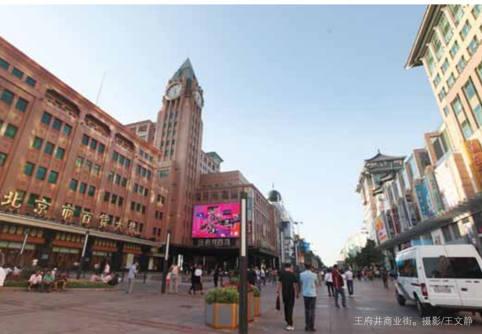
王府井商业街。

略，加以重视并推动。他建议，“十四五”时期，东城区应大力推动数字经济与实体经济深度融合，积极培育数字经济龙头企业，培育壮大“互联网+”平台和消费模式，采取政府主导搭建或购买服务方式，为产业落地和融合发展提供必要条件。此外，社区经济是近年来备受瞩目的新经济领域，东城区应加强调研和指导力度，帮助企业在繁荣社区经济的同时，实现政府保民生促发展的目标。