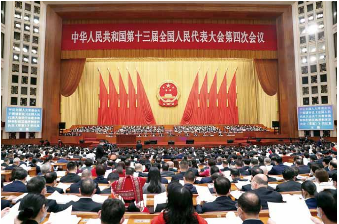
3月5日，十三届全国人大四次会议隆重开幕。