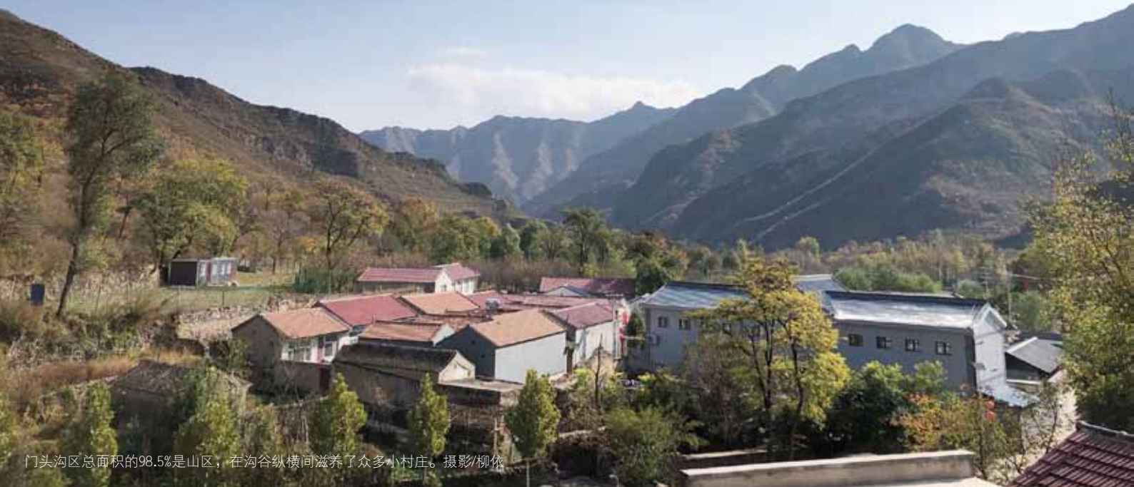
门头沟区总面积的98.5%是山区，在沟谷纵横间滋养了众多小村庄。