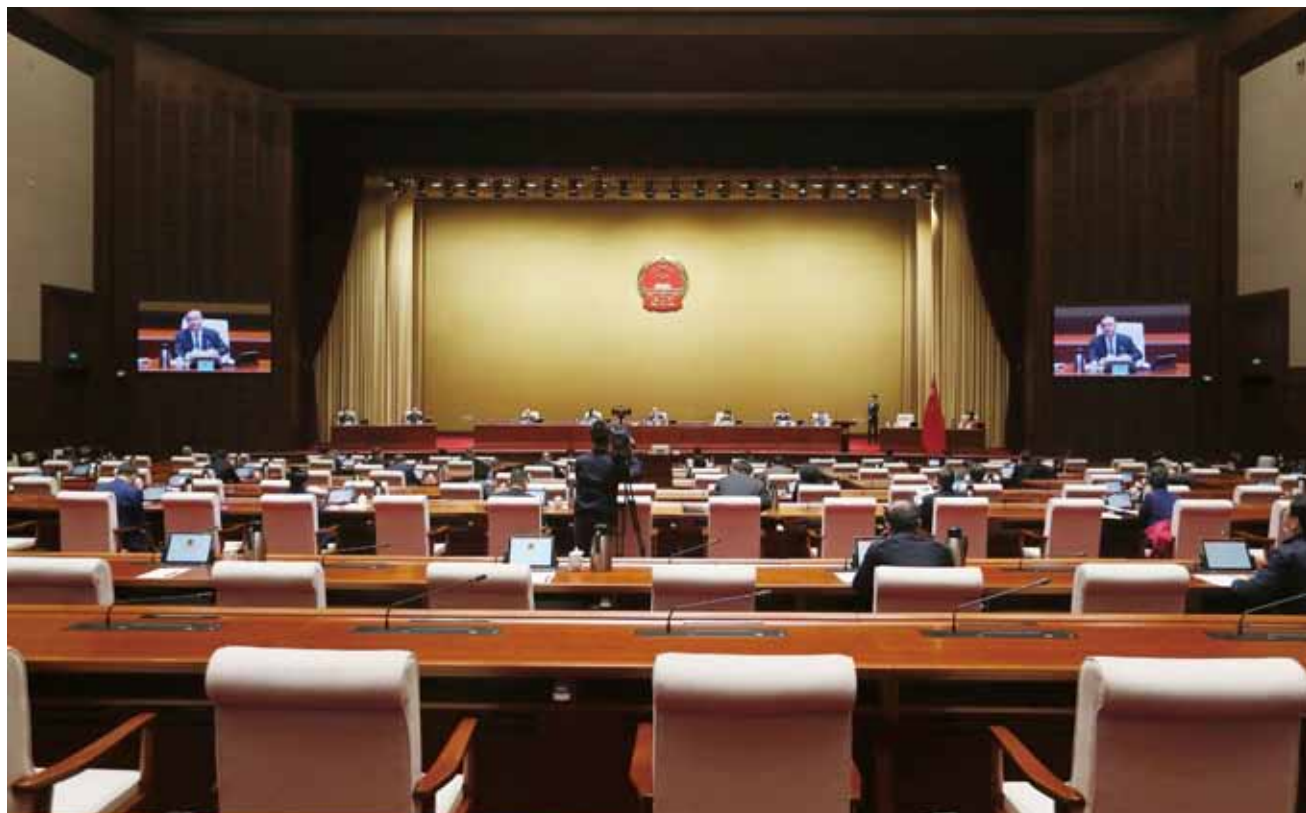
全体会议。