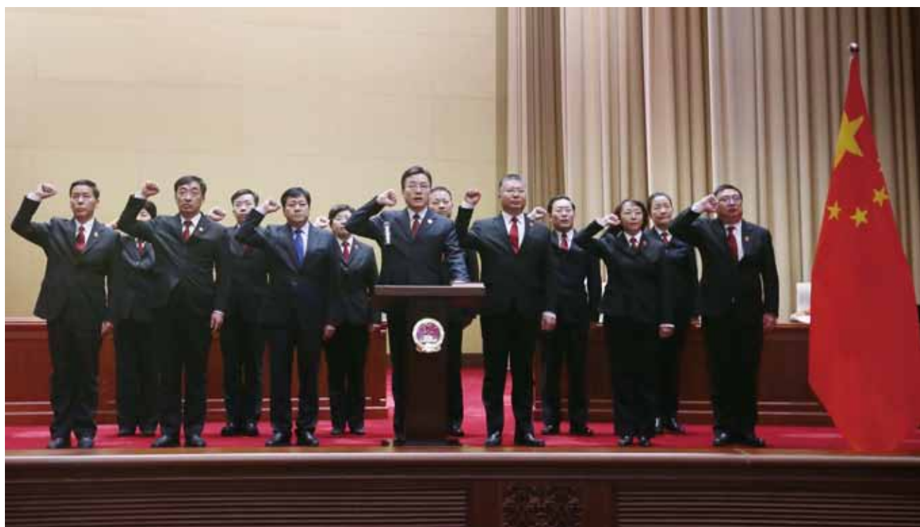
新任命国家工作人员进行宪法宣誓。