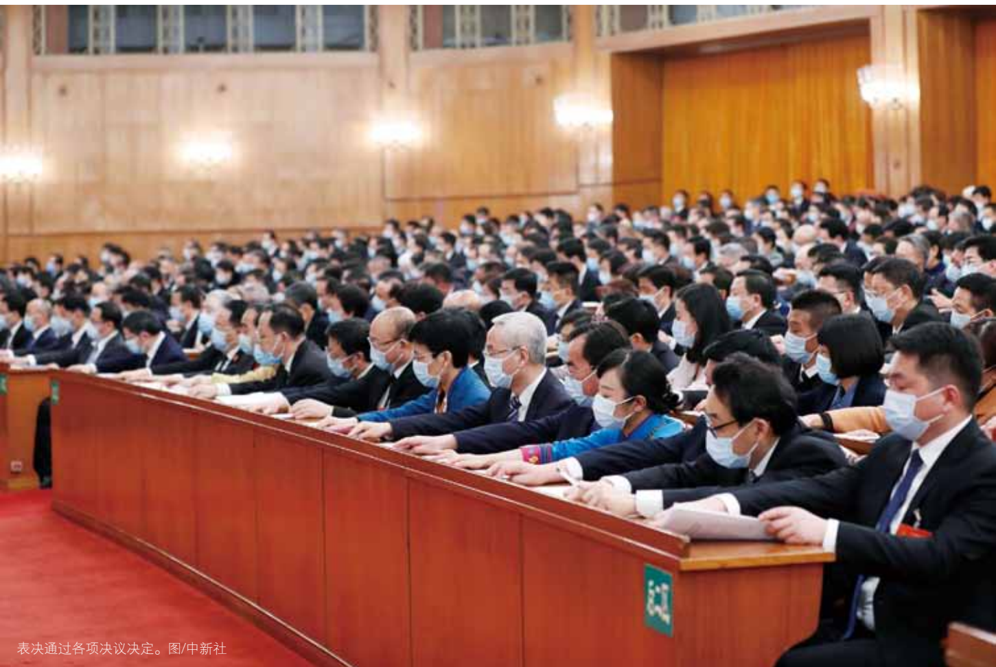
表决通过各项决议决定。

宪法有关规定的立法实施。本次修改是两部法律实施30多年来的首次修改。贯彻习近平新时代中国特色社会主义思想，总结全国人大30多年来的实践经验，全国人大组织法修正草案增设“总则”一章，规定了全国人大及其常委会的性质、定位、组织原则、指导思想，明确了全国人大及其常委会坚持中国共产党领导，明确了人民当家作主原则和依法治国原则，增加了大会任期方面的条款，进一步明确了主席团常务主席会议的职权，对大会主席团职权集中作出规定，适应监察体