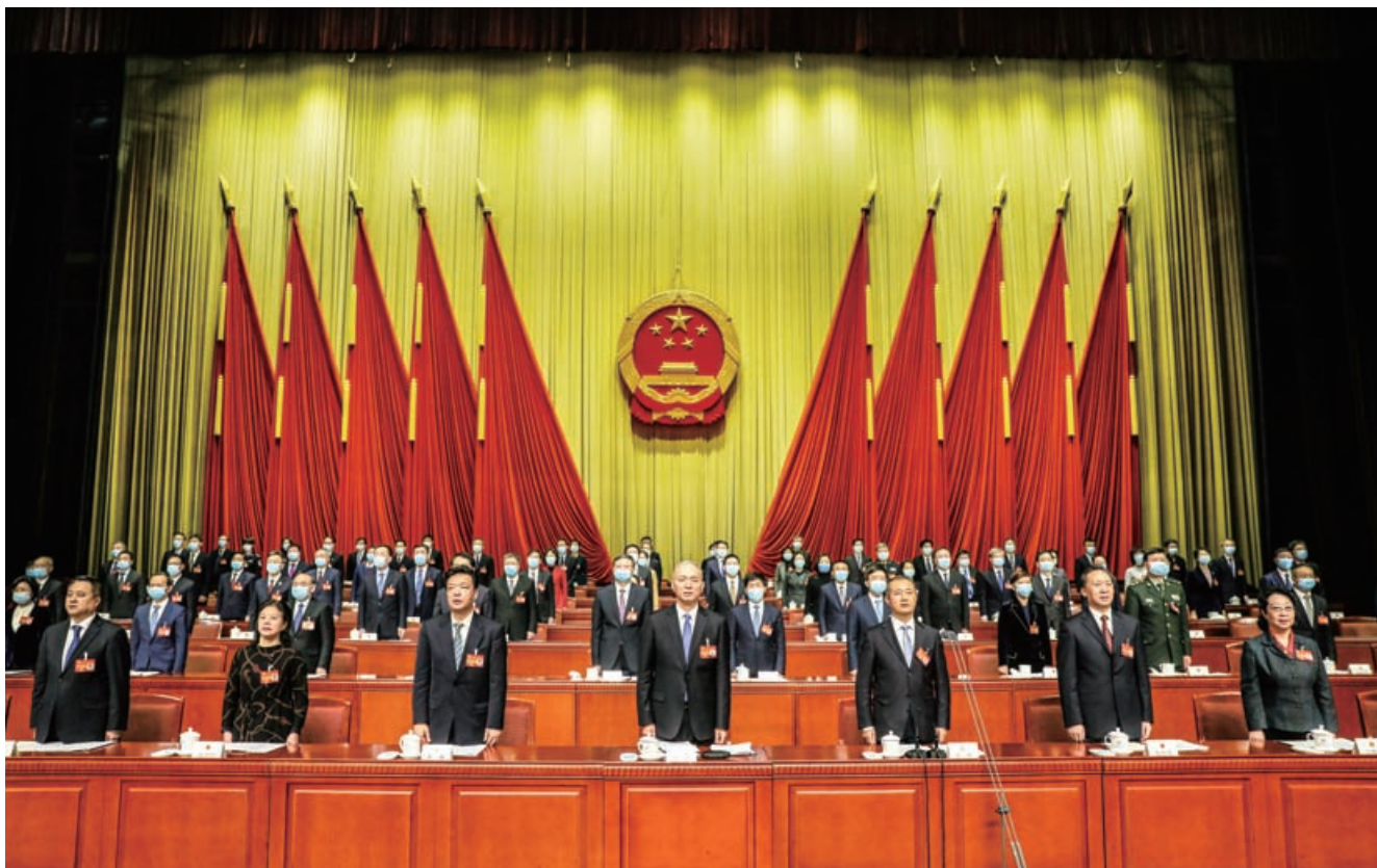
1月27日，市十五届人大四次会议胜利闭幕。