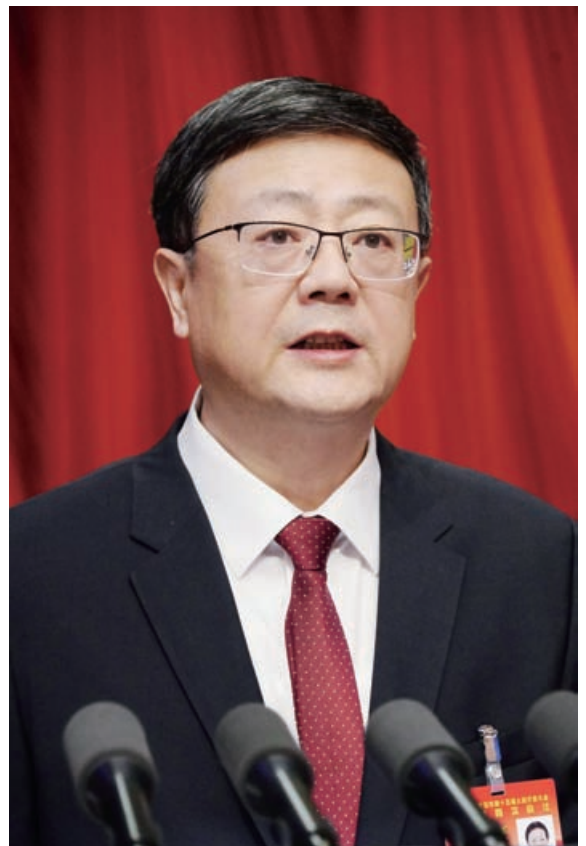
市长陈吉宁作市人民政府工作报告。