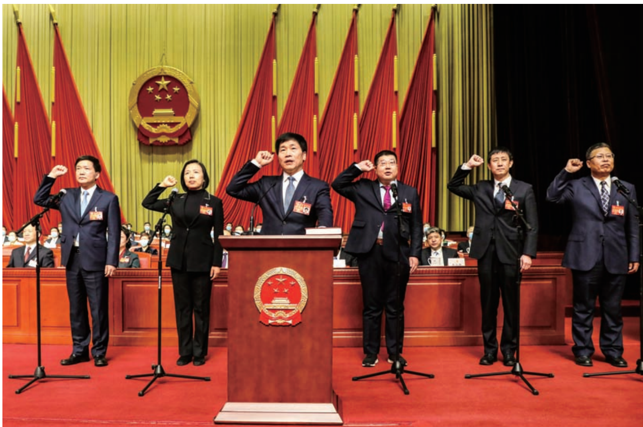
新当选的市第十五届人大常委会副主任杜飞进、魏小东，市第十五届人大常委会委员韦江、李健、张健、洪佳林进行庄严的宪法宣誓。