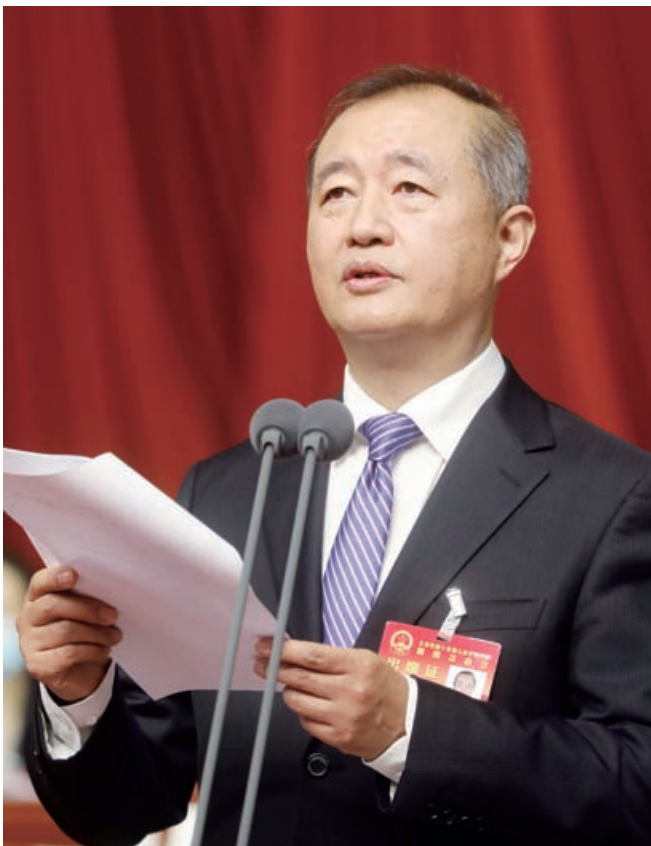
主席团常务主席、大会执行主席李伟主持会议。