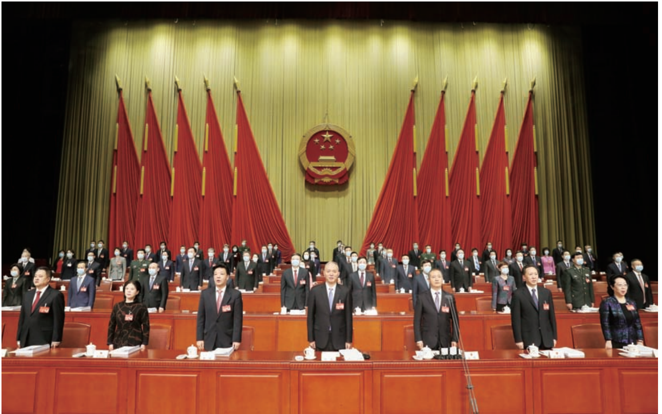
1月23日，市十五届人大四次会议开幕。中共中央政治局委员、市委书记蔡奇出席会议。图为大会主席台。