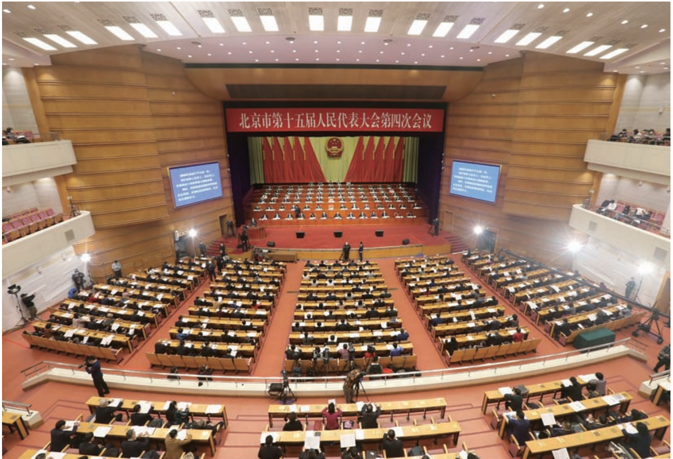
1月23日，市十五届人大四次会议隆重开幕